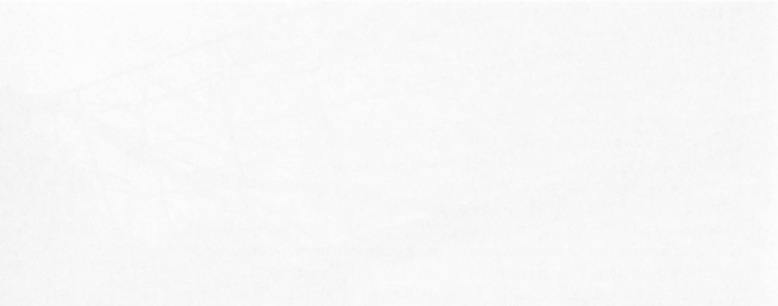
Page précédente: La SHCF a organisé une balade historique au fil de la Sarine, sur les lieux d'un passé et d'un présent sportifs.

Le 2008 a été une année riche en événements pour la SHCF. Nous avons organisé une balade historique au fil de la Sarine, sur les lieux d'un passé et d'un présent sportifs. Cette balade a permis de découvrir les lieux de naissance de nombreux clubs sportifs fribourgeois. Elle a également permis de découvrir les lieux de naissance de nombreux clubs sportifs fribourgeois. Elle a également permis de découvrir les lieux de naissance de nombreux clubs sportifs fribourgeois.