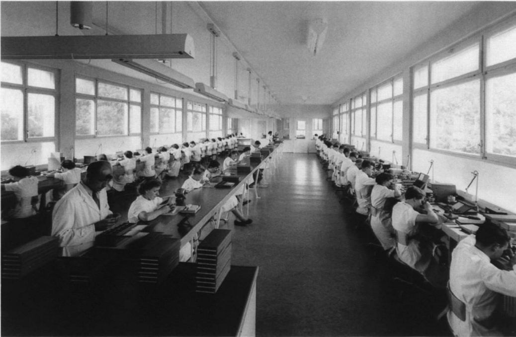
...et vers 1950 (Timor Watch): l'outil de travail s'est modernisé, la main-d'œuvre féminisée, et la production taylorisée.

autant d'exemples d'une diversification industrielle. Deuxièmement, le contexte des années 1960-1970 est déterminé par le rapprochement de la fabrique de Montilier avec Ebauches SA, propriétaire de la marque Derby. Une association qui verra pour quelques années le développement d'une production de prototypes axée sur des technologies nouvelles: le plastique, le quartz et l'électronique. Un partenariat qui fera hélas long feu, dans la mesure où la crise structurelle des années 1970 qui s'abat sur l'ensemble de la branche horlogère suisse, contraint les associations patronales à redimensionner intégralement le parc industriel du pays, faisant de Montilier, un lieu «trop petit pour la Swatch!».