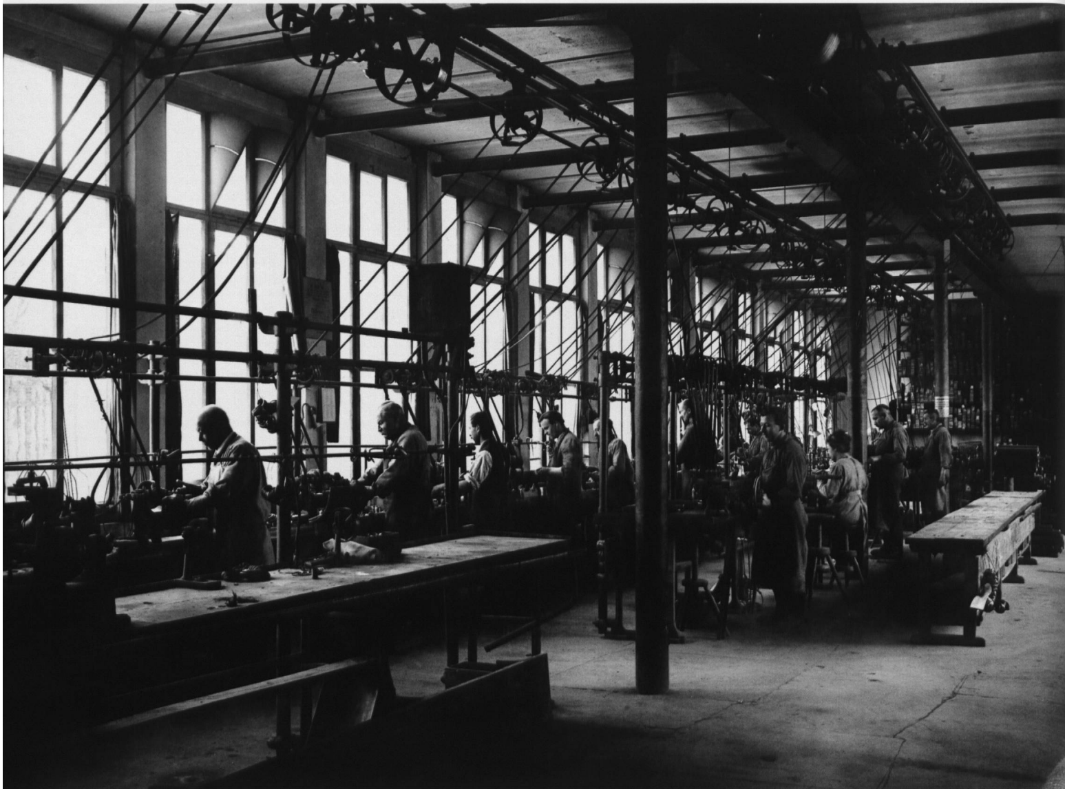
La fabrique de Montilier au début du XX e siècle...