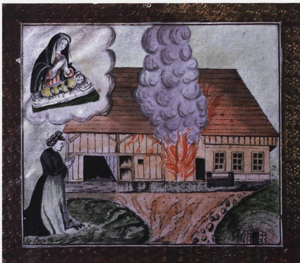
Incendie d'une ferme en Singine, ex-voto, XIX e s. Musée gruérien, Bulle.