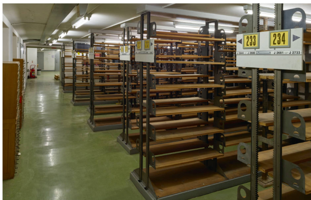
Les anciens magasins de la BCU après l'évacuation des livres.

Les attraits de la nouvelle infrastructure, mais également les nombreuses difficultés liées au bâtiment vieillissant ont été largement médiatisés ; les problèmes de stabilité des anciens magasins notamment, et les images des plafonds étayés ont sans doute eu un certain effet.