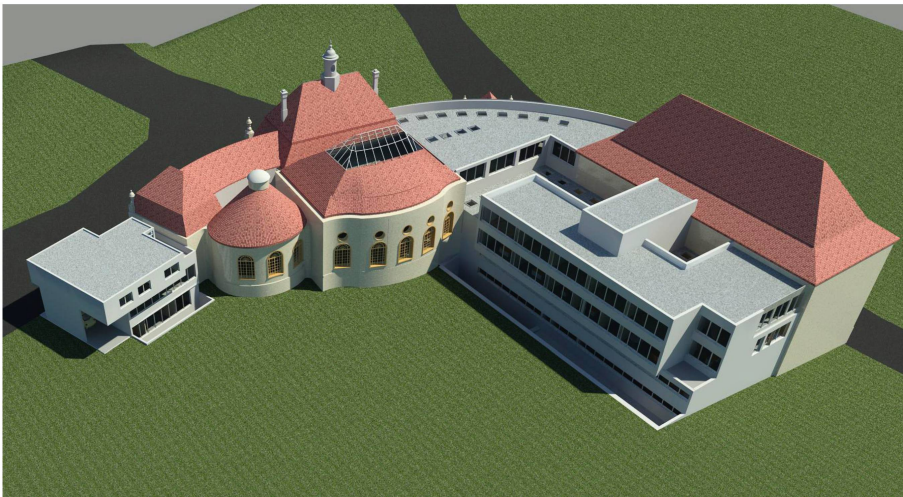
Modèle de la BCU après la transformation 1970-1975.

Romont-retour (6 camions par jour); déménagements principaux de janvier à octobre 2020, y compris une interruption en mars et avril 2020 due à la pandémie Covid-19.