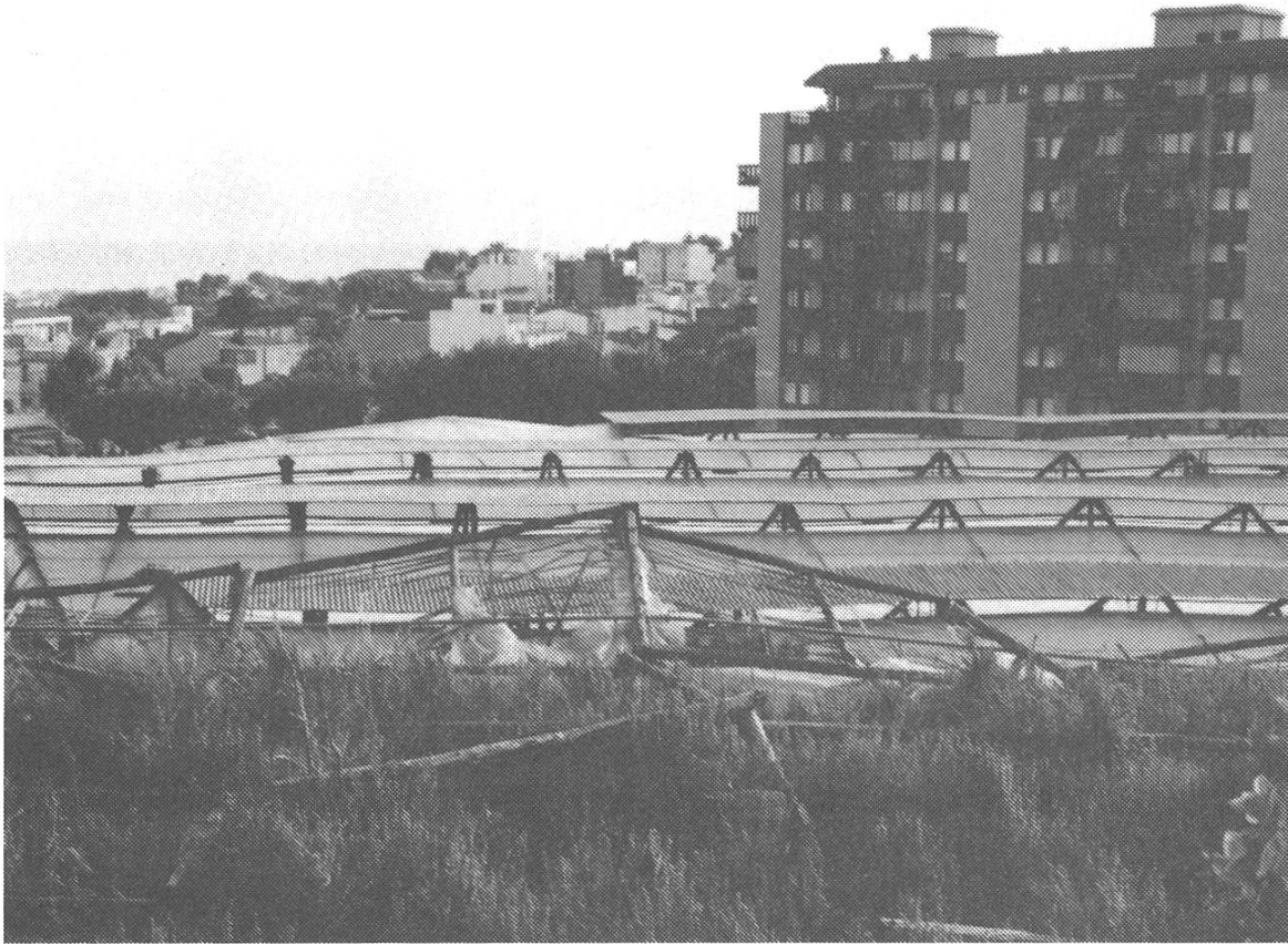
Bild 2: Der Urbanisationsdruck Barcelonas droht den Schnittblumenanbau zu verdrängen