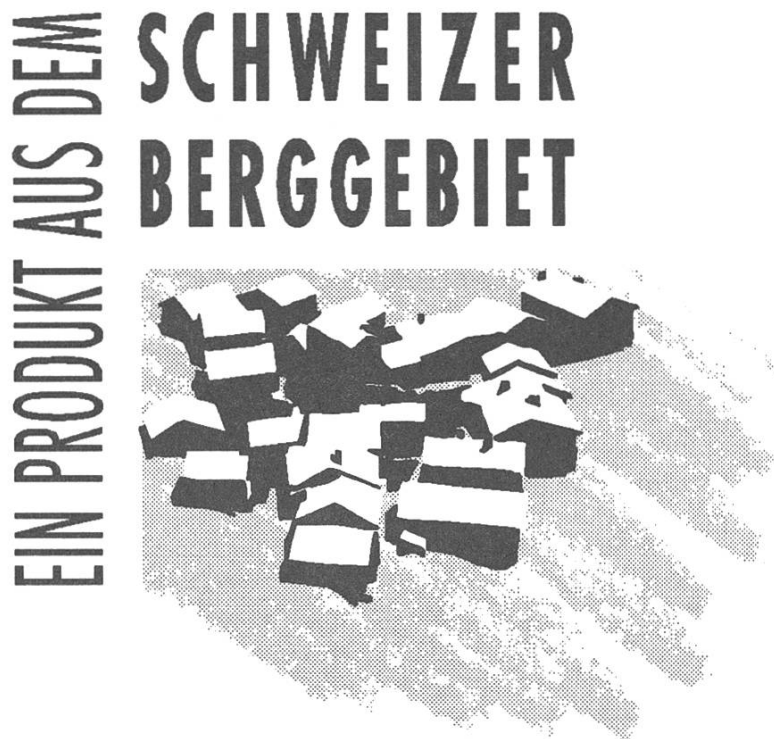
Abbildung 1: Die SAB-Marke steht als gemeinsame Marketingplattform für Produkte aus dem schweizerischen Berggebiet.