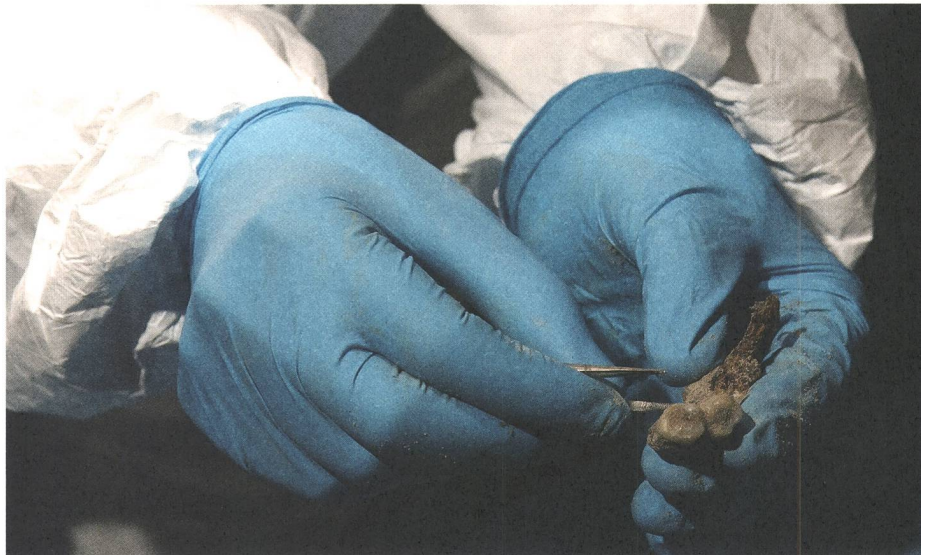
Abb. 6: Universität Zürich, 2012. Im Labor des Instituts für Evolutionäre Medizin wird aus dem Knochenpulver DNA extrahiert.

Abb. 5: Chur, Kathedrale St. Mariae Himmelfahrt. Exhumation im März 2012. Ein geeigneter Zahn wird aus dem Unterkiefer entfernt.