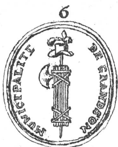
ARMES DES SIEURS DE GRANDSON.