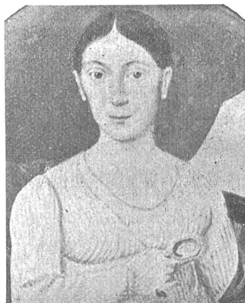
Fig. 65 (voir p. 111) MARGHERITA PEDROTTI 1787—1859

ALBERTO ANGELO ENRICO TURCHI né le 28 mars 1862 et mort le 11 septembre 1884.