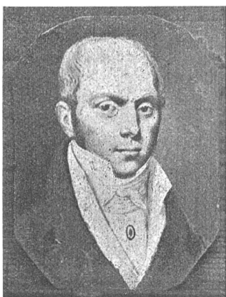
Fig. 64 (voir p. 111) ANGELO FORTUNATO PROTASO TREZZINI 1779—1833