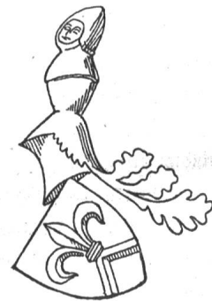
Steinrelief an einem Pfeiler der St. Peterskirche zu Basel. Fig. 20

Festschrift zum vierhundertsten Jahrestag des ewigen Bundes zwischen Basel und den Eidgenossen. 13. Juli 1901.