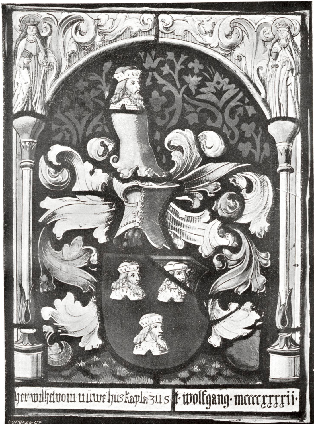
Vitrail aux armes de Petermann de Faucigny (Musée cantonal de Fribourg)