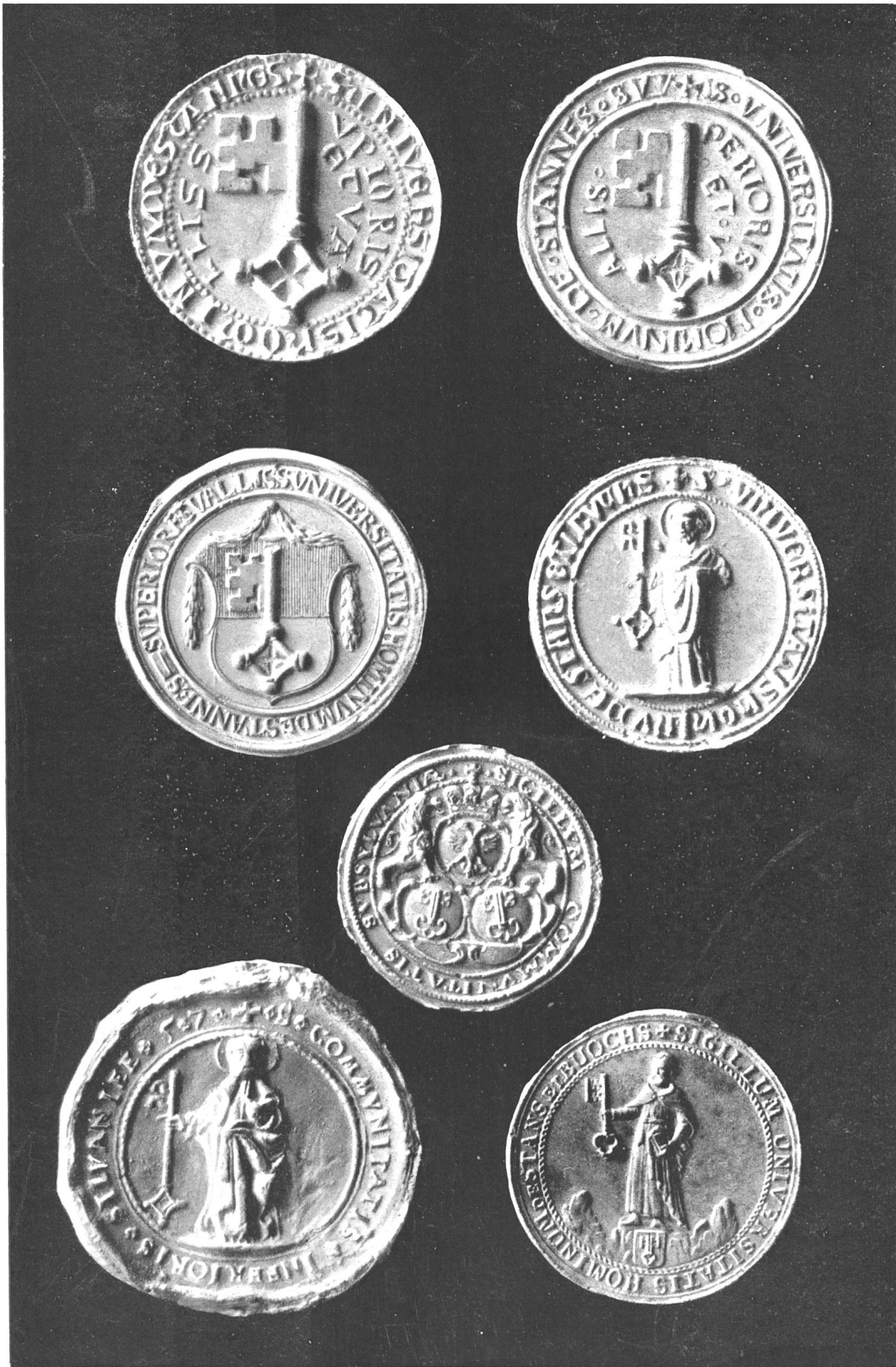
1. Altes gemeinsames Landessiegel. 2. Obwaldner Landessiegel seit ca. 1548. 3. Obwaldner Landessiegel XVIII. Jahrh. 4. Ältestes Nidwaldner Landessiegel 1363 (1344?). 5. Nidwaldner Landessiegel XVII. Jahrh. 6. Nidwaldner Landessiegel von 1557. 7. Nidwaldner Landessiegel von 1806.