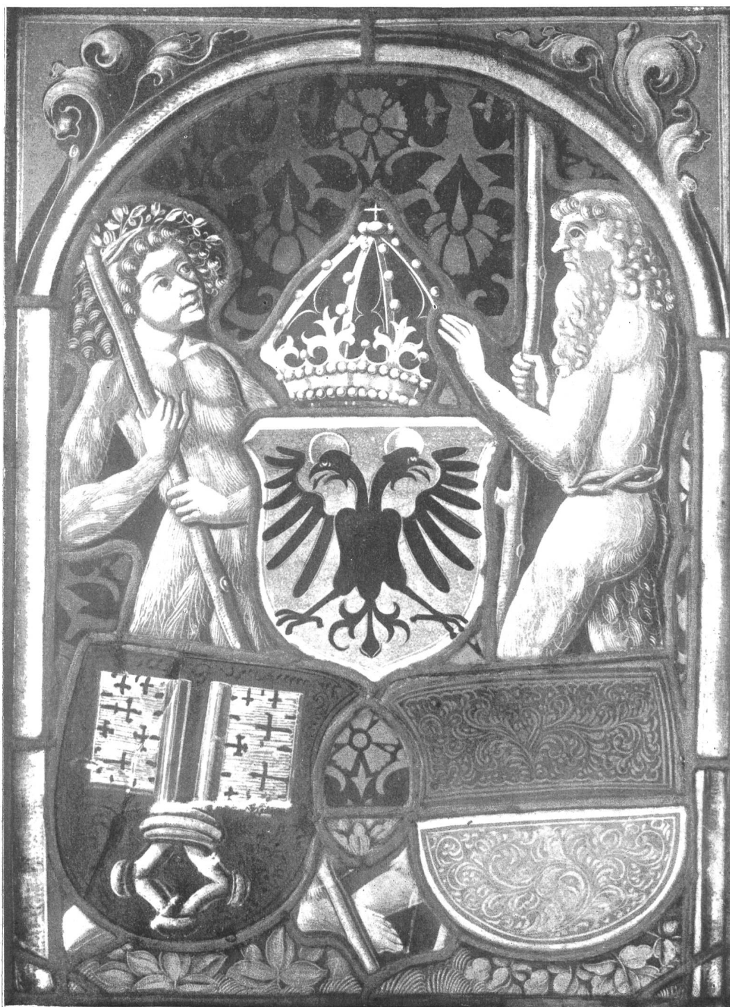
Unterwaldner Scheibe mit dem Wappen beider Landesteile, ca. 1505.

Schweiz. Landesmuseum, aus der Sammlung Martin Usteris, vielleicht ursprünglich im Rathaus zu Baden.