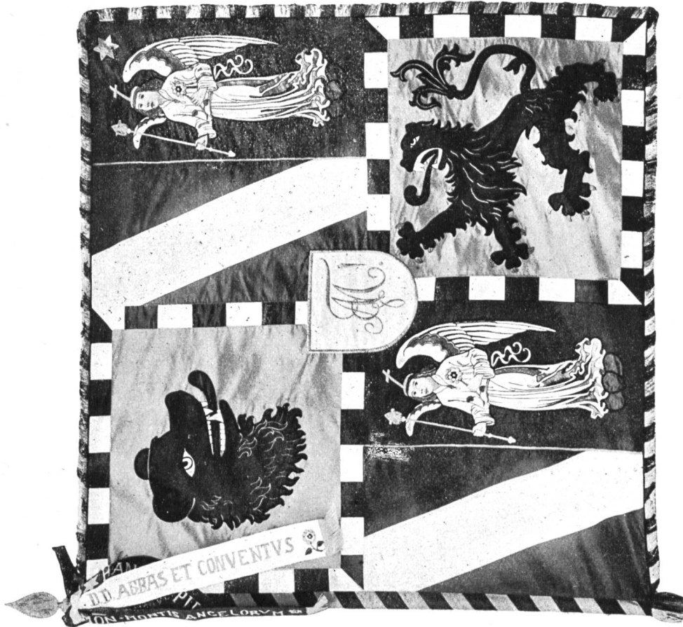
Eine neue heraldische Fahne der «Angelo-Montana»,

Sektion des Schweiz. Studentenvereins an der Stiftsschule von Engelberg.