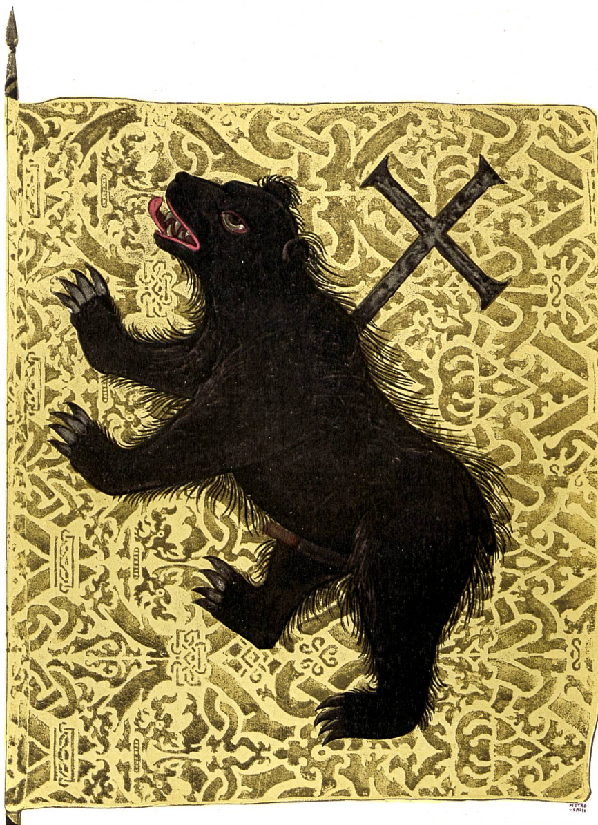
Juliusbanner der Talschaft Ursern 1512.

Schweizer. Archiv f. Heraldik 1911, Heft 3, S. 140.