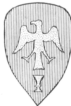
Fig. 18 Armoiries de l'émir Toukouzdimour (vers 1331).

L'archéologie orientale fera peut-être, un jour, des découvertes qui changeront l'aspect de la question; mais, en l'état actuel de nos connaissances, il n'est pas légitime de supposer que les Européens aient adopté, à l'imitation des Sarrazins, l'usage des écus armoriés, puisque ces écus armoriés apparaissent en Occident dès le milieu du XII e siècle, c'est-à-dire plus tôt qu'en Orient.