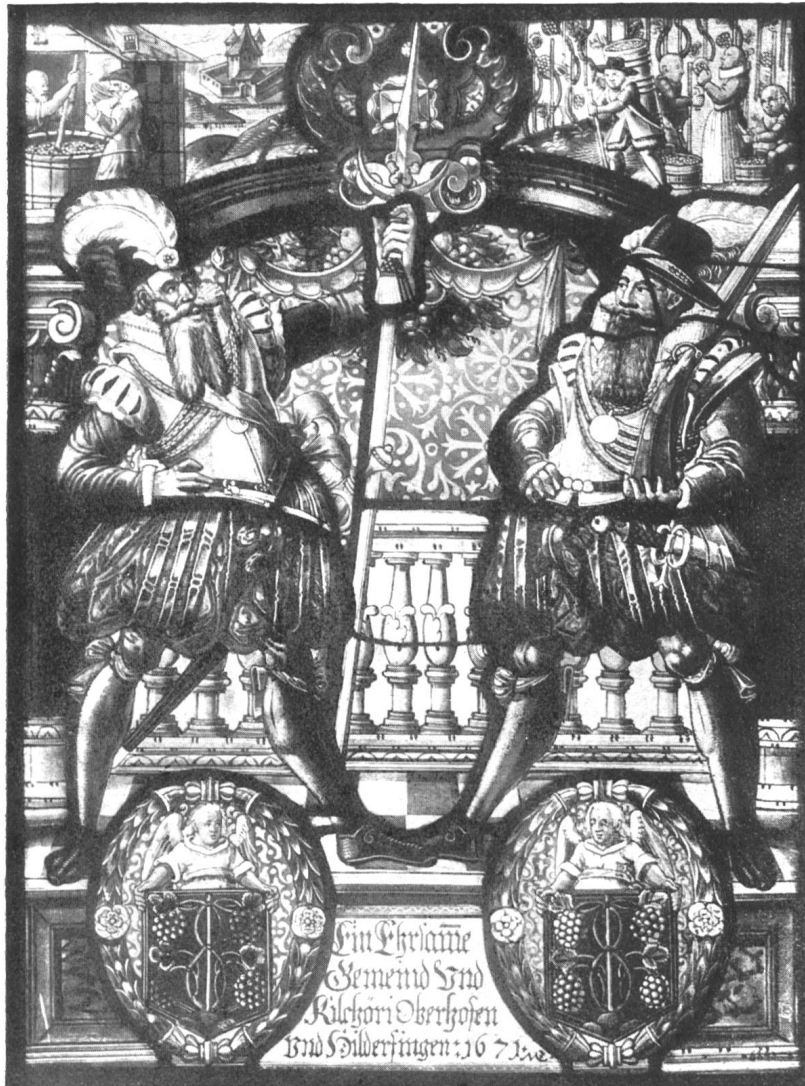
Wappenscheibe aus dem Museum Bern mit den Wappen von Oberhofen und Hilterfingen.