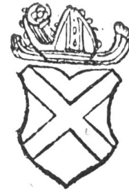
Fig. 119 Wappen des Klosters Kazis.

Am Ausgang des Mittelalters erlebte das Stift eine ruhige Entwicklungsperiode. Der Bundesschwur des Abtes Peter von Puldingen 1424 verlieh ihm neuen Halt im Volk, obwohl er anderseits auch den Grund legte zur Selbständigkeit des Hochgerichts, das im Laufe des 15. Jahrhunderts ein Recht nach dem andern dem Kloster entwand, bis die Folgen der Reformation eine solche Umkehr der Gewalten hervorriefen, dass 100 Jahre lang die einstigen Untertanen den Abt wählten 2 .