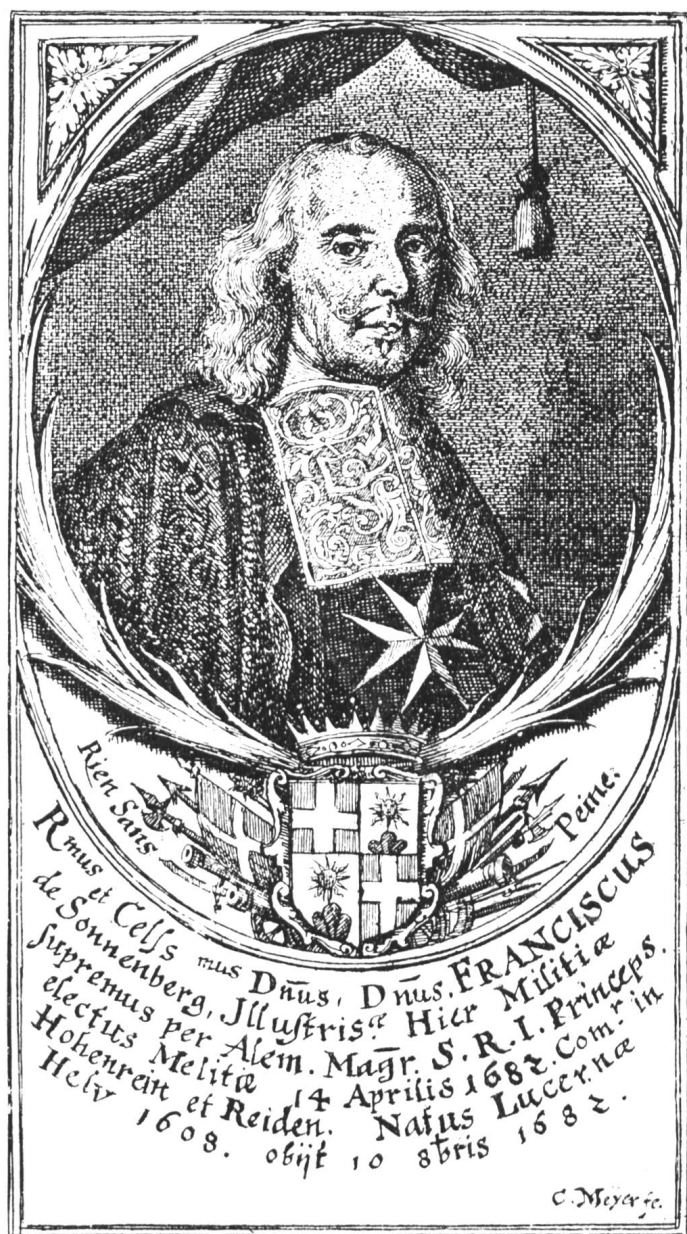
Fig. 129 Franz von Sonnenberg.

Erträglichere Verhältnisse zwischen den deutschen und schweizerischen Ordensrittern traten jedoch auch in der Folge nicht ein. Die Schweizer konnten es nie vergessen, dass man ihre Ritterzahl auf drei beschränkte, während doch diejenige der deutschen Ordensritter unbestimmt blieb. Sie machten dem Papste Vorwürfe, dass er dieses Unrecht nie aufhebe, und weigerten sich 1701 aus diesem Grunde sogar, eine Abordnung nach Rom zu schicken 1 . Die deutsche Zunge ihrerseits fuhr in ihrer alten Praktik fort, indem sie bei Vergebung von Komtureien die schweizerischen Malteserritter vielfach überging und in den Ordenskalendern bei ihren Namen ausnahmsweise den Heimatort hinzufügte, was als Beleidigung aufgefasst wurde. Zudem zeigte sie immer mehr das Bestreben, die Schweizer von den ersten Würden, wie das Grosspriorat und das Generalrezeptorat, auszuschliessen.