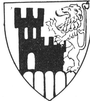
Fig. 155 Windisch.

Windisch (Acta Mur. Windisso, 1175 Windisse; im Habsb. Urbar zum Eigenamt gehörig, 1415 an Bern: OA Königsfelden, G Königsfelden; Urfparrei, D Wohlen-schwil [Mellingen], AD Aargau, B Konstanz), wozu Oberburg (im Habsb. Urbar Oberenburg) gehört, führt auf Fünfberg eine Burg, gehalten von einem steigenden Löwen, die Burg soll grau, der Löwe gelb sein! Richtigerweise wird darzustellen sein: auf grünem Fünfberg in gelb eine schwarze Burg mit rotem Löwen. Das Wappenbuch des Staatsarchivs Bern gibt als Wappen von Oberburg: in weiss drei linke schwarze Schrägbalken,