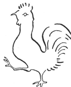
Fig. 236 Ancienne marque à feu de Paudex.