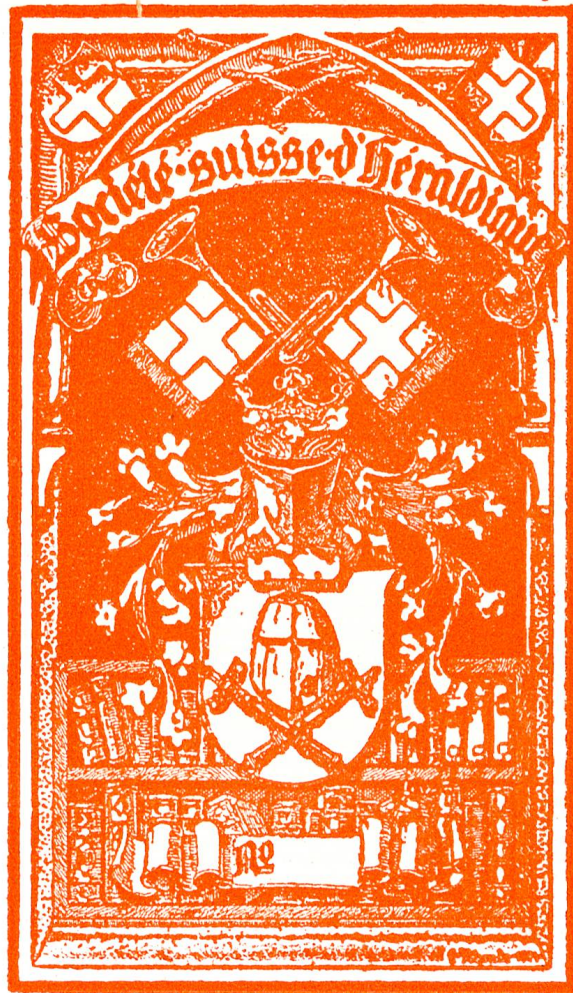
Exlibris der Schweizerischen Heraldischen Gesellschaft