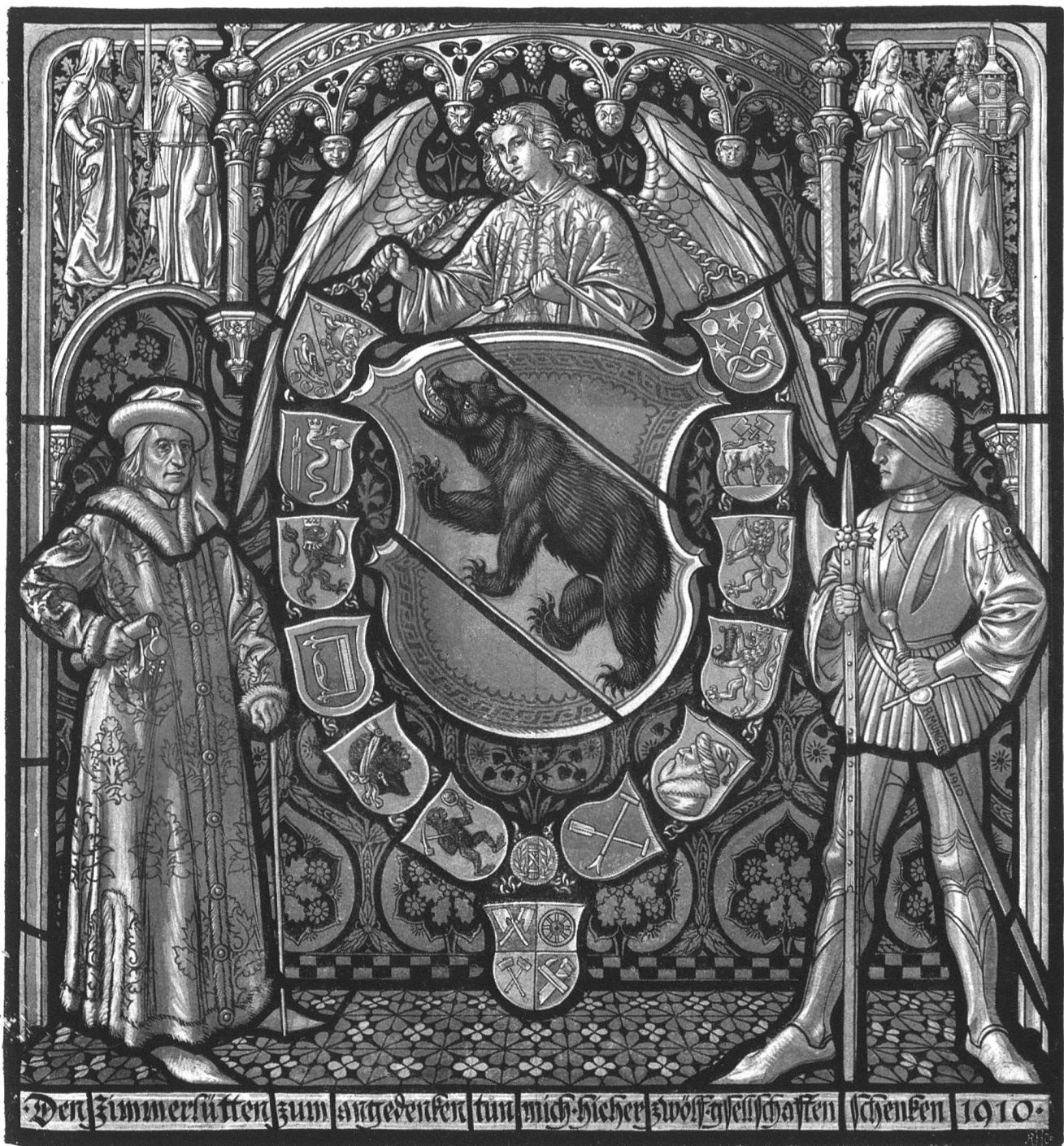
Glasgemälde der Zunftgesellschaft von Zimmerleuten zu Bern in ihr neues Haus gestiftet von den 12 Schwester-Zünften (Höhe ca. 80 cm)

Von Rud. Minger gezeichnet und ausgeführt