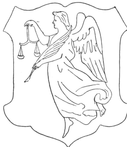
Fig. 140 Wappen von Gerzensee (Relief auf der Glocke).