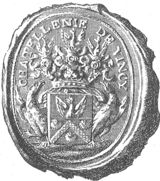
Fig. 65 Sceau de la châtellenie de Vincy.