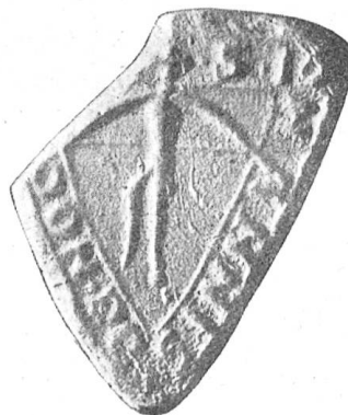
Fig. 37 ⚡ · S · IOHANNIS · DE · HOC · · · · · 1235

Siegel „von Hochdorf“ nannte und offenbar als persönliches Abzeichen eine Armbrust im Schilde führte (Fig. 37), gehört wohl auch diesem Geschlechte an. Er machte 1235 Vergabungen zu Huprechtlingen an Engelberg. — Walther II., Chorbherr zu Münster (1250—1269), dürfte der letzte dieses Stammes gewesen sein.