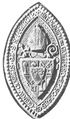
Fig. 63 Grand sceau de Mgr Colliard.

Les héraldistes suisses apprendront avec plaisir que Mgr Colliard cultive depuis longtemps avec passion, dans ses moments perdus, le « noble savoir ». Connu comme héraldiste, la Société d'histoire lui confia en 1902 le soin de rassembler et d'étudier les armoiries communales du Canton de Fribourg, mais à cause d'un surcroit de travail puis de son éloignement du Canton il dut renoncer à ces recherches et ce travail fut alors remis à l'auteur de ces lignes. Mgr Colliard a toujours suivi avec le plus vif intérêt les travaux de la Société suisse d'héraldique. Nous le comptons dès 1902 parmi les abonnés de nos Archives héraldiques suisses et en 1910 il se fait recevoir membre de notre société. Il espérait toujours reprendre une fois, lorsque le temps le lui permettrait, ses études de prédilection, mais sa paroisse l'absorbait de plus en plus et dans une lettre qu'il nous adressait en mai 1909 il évoquait « des projets amoureusement caressés autrefois et qu'il ne pourrait jamais exécuter », et nous parlant de sa grande paroisse du Locle, il ajoutait: « j'ai dû dire adieu à bien des choses et j'en suis réduit à suivre des yeux la marche des autres et à applaudir à leurs travaux en regrettant de n'y pouvoir prendre part ».