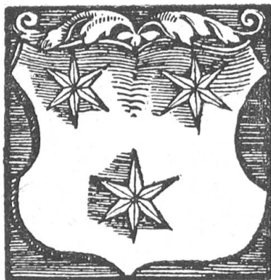
Fig. 92 Wappen des Sarganserland nach Stumpf, 1548.

dieser letzteren Linie geblieben und kommt 1483 durch den letzten Grafen Georg käuflich an die VII ältesten Orte ohne Bern, 1712 auch unter die Mitherrschaft dieses Standes. Von da an senden die VIII alten Orte abwechselnd auf zwei Jahre einen Landvogt, der im Schlosse Sargans wohnte und daselbst als oberster Richter auftrat. Unter dem Vorsitz des Vogtes bestund ein Landrat, der aber nur unbedeutende Befugnisse hatte. Das ganze Land war in 6 Gerichte eingeteilt.