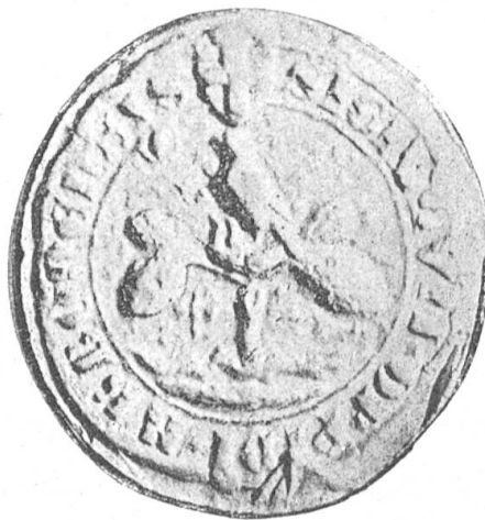
Fig. 100 Grosses Siegel der Stadt Arbon.