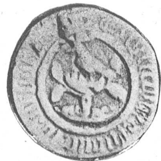
Fig. 101 Kleines Siegel der Stadt Arbon.

Die Nachricht des Herrn Verfassers, es sei das nebenstehende Wappen von einem Zeichnungslehrer im Stadtarchiv Zürich entdeckt worden, dass es wahrscheinlich aus dem 16. Jahrhundert stamme usw., braucht auf ihre Richtigkeit nicht nachgeprüft zu werden. Es ist vollständig belanglos, ob wirklich ein Maler des 16. Jahrhunderts oder ein Zeichnungslehrer der modernen Schule dieses Bild gefunden, erfunden oder entworfen habe, massgebend für ein Wappen der Stadt Arbon ist nur das alte Siegelbild, weil wir es tatsächlich besitzen, und weil es weit vor dem 16. Jahrhundert erscheint. Wenn es auch zufällig auf Rechtsalter-