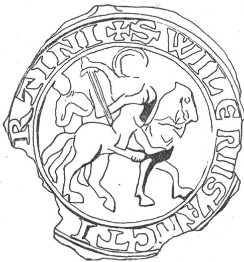
Fig. 19 Sceau de Guillaume de Saint Martin, Seigneur de Biolay, 1245.

de Biolay (Fig. 19), de petrus de Sancto Martino canonicus lausannensis (Fig. 20) et de Richardus dominus de Sancto Martino (Fig. 21). Le premier sceau est unique, croyons-nous, parmi les sceaux des dynastes romands, car il représente Saint Martin à cheval, partageant son manteau avec le pauvre. Le sceau de Pierre est intéressant par un autre côté: le faucon dévorant un oiseau qui s'y trouve, dévoile les goûts du chanoine chasseur. Celui de Richard enfin nous offre un écu à trois barres . M. Coulon a décrit dans son Inventaire des des Sceaux de la Bourgogne , No. 458, le sceau scutiforme de Richard (III), fils du précédent. Il se trouve aux Archives de la Côte-d'Or, (B 1232) attaché à une déclaration d'Uldric, frère du dit Richard, au sujet de son château de Châtillon super villam de Cronay , tenu en fief de Pierre de Savoie, datée d'avril 1255. L'écu arrondi montre trois pals .