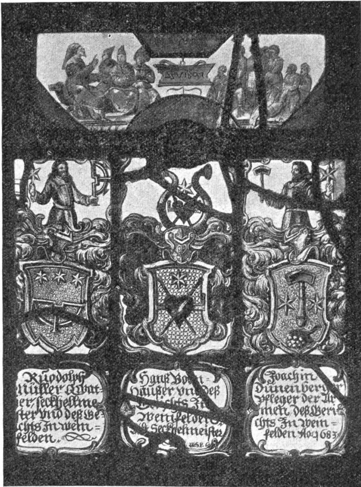
Fig. 21. — Wappenscheibe von 1683 (heute im Rosgartenmuseum zu Konstanz).

Die Diethelm von Weinfeld sind nicht mehr dort ansässig. Die gemeinsame Abstammung mit den Diethelm von Uttwil bezeugt das Zürcher Ehegerichtsprotokoll von 1609 X 3.