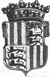
Fig. 75. Wappen des Königl. Kollegiatstiftes über der Pforte der Propstei in Solothurn.

aus dem herzoglichen Hause Schwaben stammen, weshalb man ihr auch das Wappen dieses Geschlechtes : drei schreitende Löwen beigab. Ohne Zweifel haben wir bei Stumpf die Quelle zu suchen, woraus das Kapitel von Solothurn die Nach-