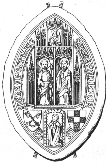
Fig. 151. Sceau de la cour de l'auditeur apostolique sous Clément VII.

Un sceau de Clément VII comme cardinal a déjà été publié dans les Archives héraldiques en 1917 (p. 103, fig. 76).