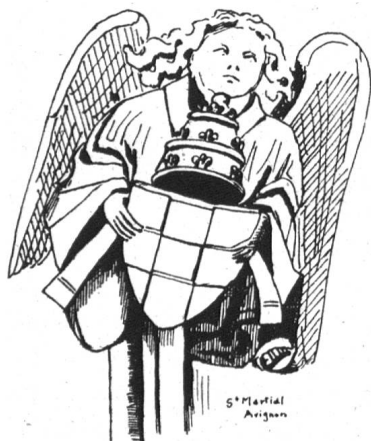
Fig. 149. Armoiries du Pape Clément VII. Cul de lampe à l'église St-Martial à Avignon.

petits cercles renfermant chacun les armes des comtes de Genevois, les cinq points équipolés. Le coussin lui-même est orné de losanges renfermant chacun alternativement les armes du St-Siège : les deux clefs posées en sautoir et liées par un