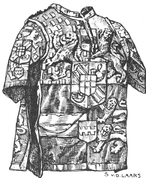
Fig. 87. — Manteau d'un héraut d'armes (Musée royal).

Les prétentions des Châlon à cette succession les mirent pendant un quart de siècle en compétition avec les comtes de Savoie. Ce n'est qu'en 1424, par un traité passé à Morges, que le prince Louis d'Orange céda au duc Amédée VIII tous