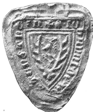
Fig. 121. Johann v. Hertenstein, Edelknecht, 1322.