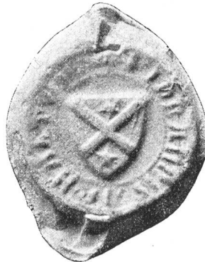
Fig. 125. Johann v. Malters 0000