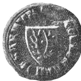
Fig. 123. Rudolf d. Kelner von Sarnen 1321.

Es ist wohl kein Zufall, dass im Zusammenhang mit den blutigen Fehden zwischen Ghibellinen und Welfen und den ersten Freiheitskämpfen der Urschweiz, Walther v. Hunwyl (1238-1257) bald als Ammann, bald als Schultheiss an der Spitze der damals mit Unterwalden verbündeten Stadt (coniurati nostri de Lucerna) stand und an erster Stelle an deren Friedensschlüssen von 1244, 1252 und 1257 mit den Vögten von Rothenburg und ihren Helfern mitwirkte.