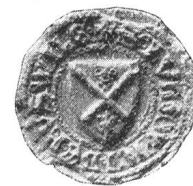
Fig. 132. Ludwig v. Ruswil 1330

erste, zunächst private, Verbindung von 28 Luzerner Ratsherren. Die Ritter Wernher und Walther v. Hunwil schlossen sich ihr ebenfalls an.