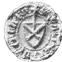
Fig. 129. Walther v. Greppen 1330