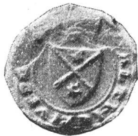
Fig. 130. Walther uf der Ruse 1330