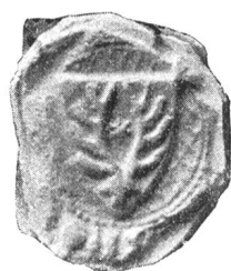
Fig. 120. Mathis v. Obernau, 1347.

Schon wiederholt sind die Wappen luzernischer Geschlechter in dieser Zeitschrift besprochen worden, welche unter der oligarchischen Verfassung Träger der Staatsgewalt waren. Es mögen hier nunmehr Mitteilungen über einige mittelalter-