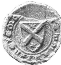
Fig. 131. Dietmar Meyer v. Emmen 1330