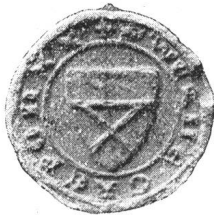
Fig. 127. Werner v. Greppen 1330