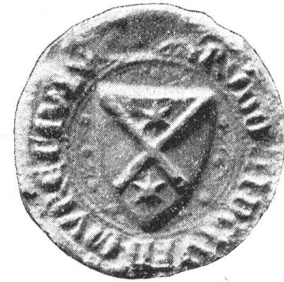
Fig. 126. Rudolf auf der Mauer 1344