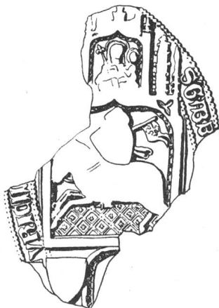
N° 111. Girard II, abbé, 1376.