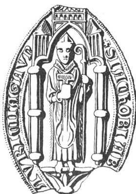
N° 103. Jacques, 1293.