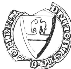
N° 58. Collombey. 1267.