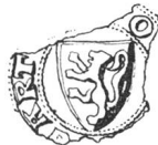
N° 52. Blessens. 1294.