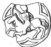
N° 115. Jean II, abbé, 1402.