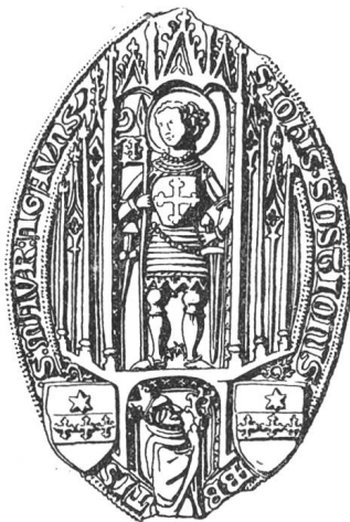
N° 116. Jean III, 1414.