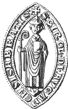
N° 98. Girold, 1262.