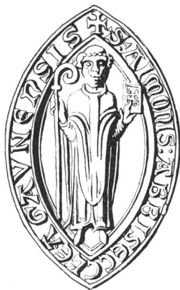
N° 96. Aymon II, 1215.