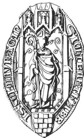
N° 110. Jean Ier, 1358.