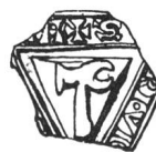
N° 65. Martigny. 1269.