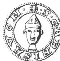
N° 99. Girolld, abbé, 1203.