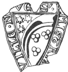
N° 66. Métral de Villeneuve. 1263.