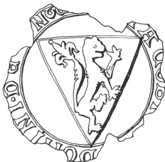
N° 59. Conthey. 1249.