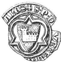
N° 63. La Tour-Châtillon. 1291.