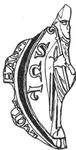
N° 95. Guillaume Ier, 1178/1198.