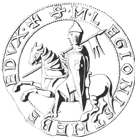
N° 93. Le Chapitre. XII e siècle.