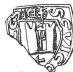
N° 60. Criez. 1296.