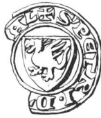
N° 90. Villy. 1329.