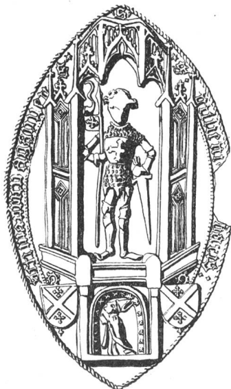
N° 118. Guillaume II, 1428.