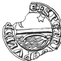
N° 53. Baltshieder. 1296.