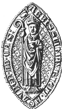
N° 109. Barthélemy II, 1349.