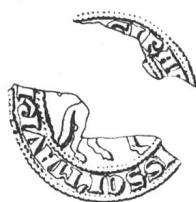
N° 102. Girard, abbé, 1291.