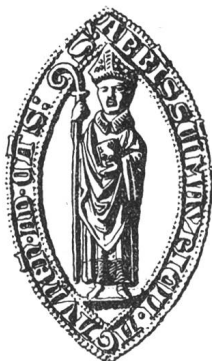
N° 105. Jacques, 1296.