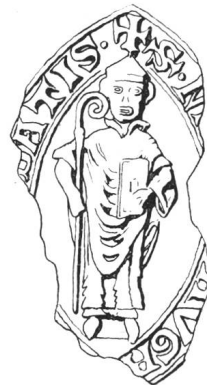
N° 97. Nantelme, 1257.