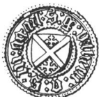
N° 119. Guillaume II, 1428.