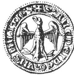
N° 70. Oron. 1267.