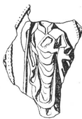
N° 100. Pierre Ier, 1280.