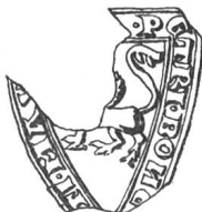
N° 91. Benet. 1265.