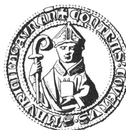
N° 94. Le Chapitre, 1303.