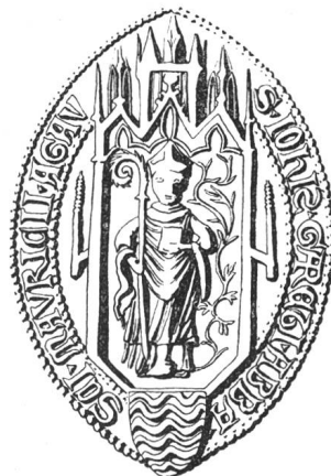
N° 113. Jean II, 1379.