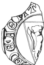
N° 51. Ayent. 1269