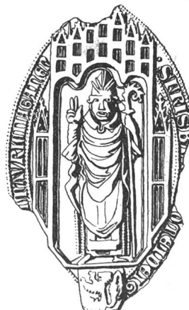
N° 108. Barthélemy II, 1351.