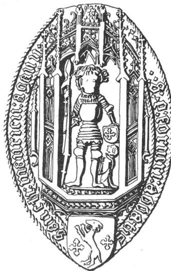
N° 120. Pierre II, 1434.