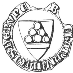
N° 61. La Roche. 1305.