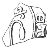
N° 80. Saillon. 1258.