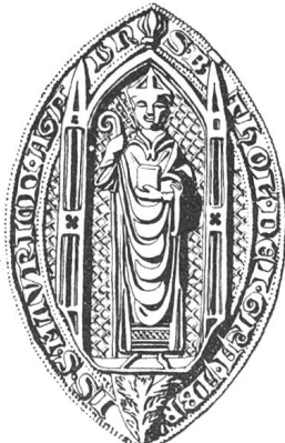
N° 106. Barthélemy Ier, 1318.