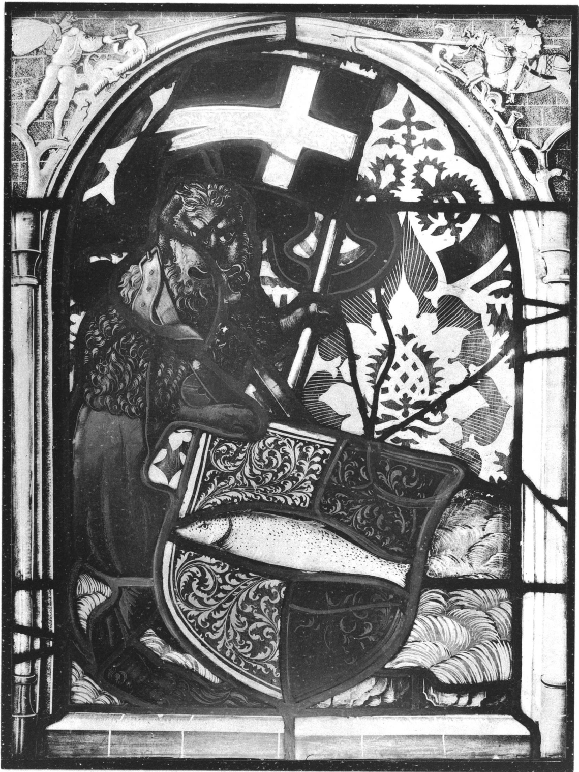
La ville de Nyon (Vaud).