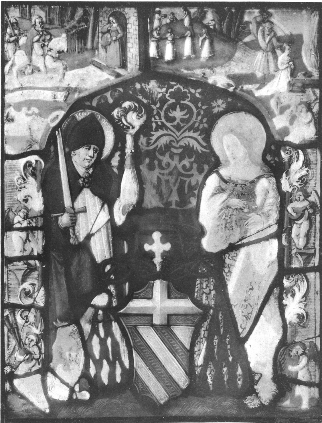
Le cardinal Schiner, 1511-1522.