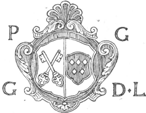
Fig. 68. Armoiries sur le sceptre de la Justice de Lugnorre, 1735.

L'historien Engelhardt nous apprend dans son histoire du district de Morat 1 que les armoiries de Lugnorre sont très anciennes et que, suivant la tradition, elles ont été concédées par les sires de Grandson.