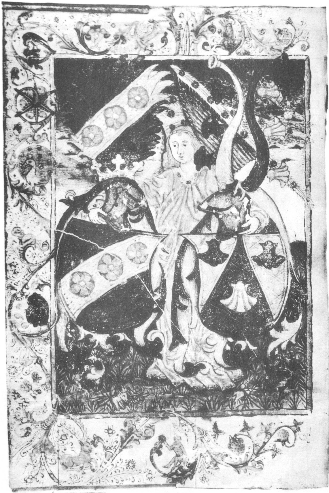
Heinrich Ehinger-von Kappel, 1470-79