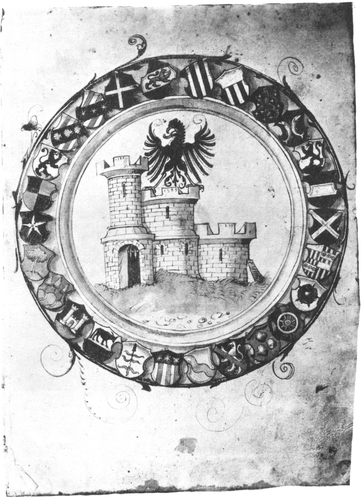
Fribourg, Municipal (1588).