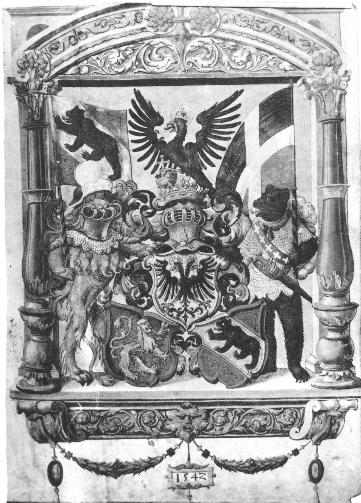
Bern, Gerichtssatzungen, 1542.