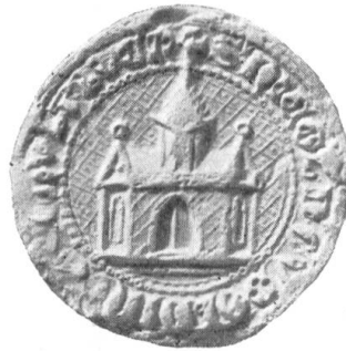
Fig. 105. Schultheiss Nikolaus v. Gundoldingen 1351.