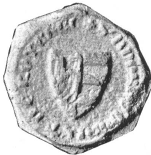
Fig. 115. Andreas v. Rothenburg 1346.