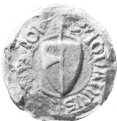
Fig. 125. Johann v. Obernau 1317.

Das Siegel Heinrichs Sartor (Incisor) von 1252 zeigt einen Löwen mit einem Busch auf dem Kopfe. Der Schild soll weiss, der Löwe rot, der Busch schwarz gewesen sein (Fig. 124).