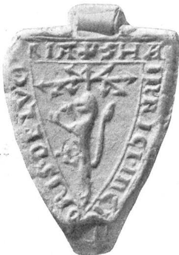
Fig. 124. Heinrich Sartor (Incisor, Cissor) 1252.