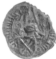
Fig. 101. Ritter Hartmann v. Malters Meyer von Stans 1336.