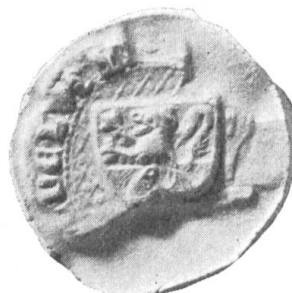
Fig. 126. Hartmann v. Obernau (Wappen v. Bramberg) 1344.

Die eingangs (Her. Arch. 1925, S. 131 u. Fig. 120-123) dargestellte Wappensippe , ist möglicherweise auf einen Ganerbenverband zurückzuführen, welchem Rudolf v. Schauensee angehörte, dessen Siegel seit 1282 in gelb ein schwarzes Zehnender-Geweih, dazwischen einen schw. Stern, zeigt (1925 S. 131). Dasselbe Wappen, jedoch weiss in rot, führten nachweislich seit 1297 (Fig. 123) die murbach-luzernischen Kellner von Sarnen (1143—1348). 1317 urkunden als Erben des Ritters