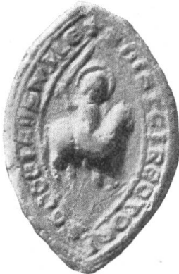
Fig. 130. Dietrich v. Schenkon Kirchherr z. Ruswil 1291.

(1381—1436) starb als letzter des Geschlechts und Probststatthalter zu Bero- münster, der jüngere Conrad (1396—1407) war Schultheiss von Liestal. Die Familie hatte rege Beziehungen zu den Kirchen von Ruswil, Geiss, Sursee, Frau- brunnen und den Minoriten zu Luzern. 1365 waren drei Herren v. Schenkon Johanniter zu Hohenrain.