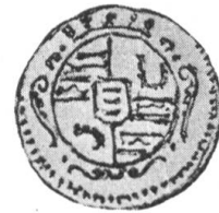
Fig. 177 b.

Münzen des Hans Luzi I, Herrn zu Haldenstein.