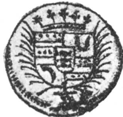
Fig. 177 a.