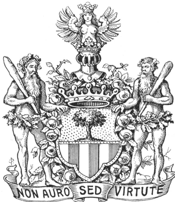
Fig. 188. Wappen der Salis-Maienfeld in Holland.