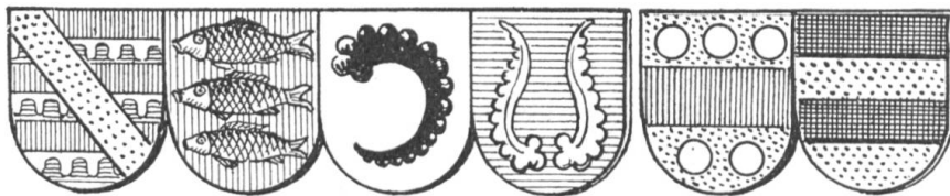
Fig. 174. Wappen von Schauenstein, Ehrenfels, Haldenstein, Lichtenstein, Grottenstein u. Hohentrins.

Nach dem Erlöschen des eigenen Adels waren diese Burgen samt Herrschaft in meist raschem Wechsel durch viele Hände gegangen, bis sie 1608 in den Besitz der Familie Schauenstein und Ehrenfels (von der Linie Cazis-Tagstein) gelangten, welche schon 1389 mit den Hallwyl, Ems und Planta Ansprüche auf Haldenstein erhoben hatte. Auch die von Schauenstein waren eines der vornehmsten und bedeutendsten Churischen Rittergeschlechter, das nach gewöhnlicher Annahme im 13. Jahrhundert aus Tirol eingewandert, am Heinzenberg oberhalb Thusis sich einen neuen Burgsitz (Schauenstein) gegründet hatte. (Wappen: abwechselnd drei glatte rote wagrechte Streifen oder Balken und drei silberblaue Pelzstreifen; darüber von rechts nach links ein goldener Schrägbalken, Zürcher Wappenrolle Nr. 508 31) . In späteren Zeiten wurde in dem gevierteten Schild das Feld