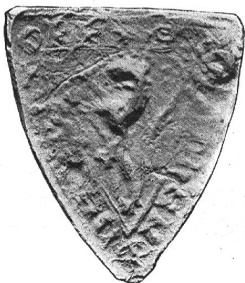
Fig. 21. Walther von Hochdorf 1231.

20. Zum Schlusse kommt hier das wenig bekannte älteste Siegel der Bürger-schaft von Luzern (☒ S · CIVIUM · LUCERNENSIVM · — Fig. 20) zur Darstellung. Es zeigt einen schräglinks gestellten Balken, belegt mit 3 kreuzförmigen Blumen oder Beschlägen. Der Ursprung dieses Bildes, das einem Privatwappen entnommen oder willkürlich gewählt sein kann, ist unbekannt. Entstanden ist das Siegel zur Zeit der Freiheitskämpfe Luzerns gegen die murbachische Grundherrschaft, in den Vierzigerjahren des XIII. Jahrhunderts. Seine älteste Verwendung dürfte an jenem undatierten Briefe einer Anzahl Nidwaldner Edler und Ammänner sein, in welchem sie der verbündeten Stadt Zürich u. a.: „Salutem et super inimicis victoriam triumphalem“ wünschten und, weil sie kein eigenes