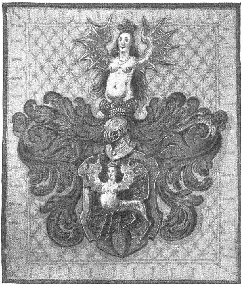
Fig. 75. Darstellung des den Weiss verliehenen Wappens im Vidimus des Wappenbriefes von 1601.

hielt. Der Freihof der Weiss ging als Eigengut ohne weiteres durch Erbgang an die Zant über, denen der Markgraf von Baden die auf dem Hause ruhenden Privilegien erneuerte. Damit war die Wagnerisch-Weissische Hinterlassenschaft in Binzen auf die Familie Zant übergegangen, jedoch ohne dass von einer Übertragung von Adel und Wappen vom ausgestorbenen auf das überlebende Geschlecht etwas bekannt wäre.