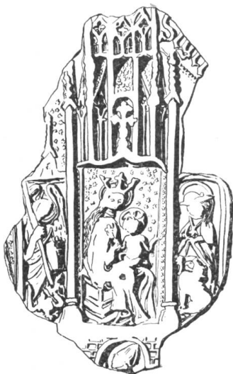
49 Georges de Saluces 1441