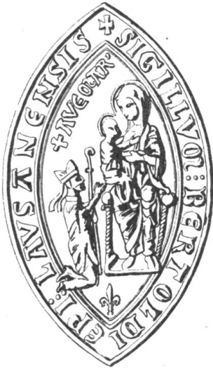
9 Berthold de Neuchâtel, 1217