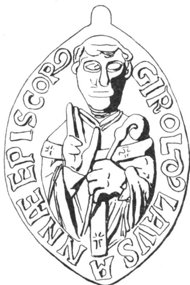
1 Girolde de Faucigny 1115