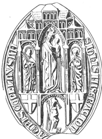
27 Jean de Rossillon 1330