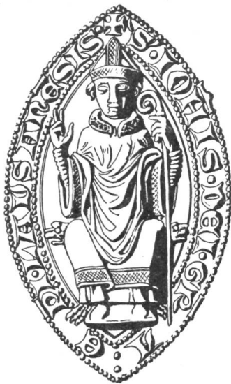
14 Jean de Cossonay 1245