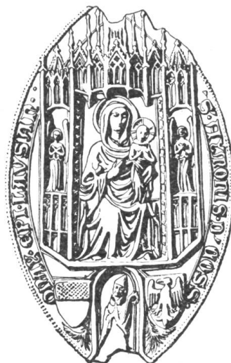
39 Aymon de Cossonay 1356