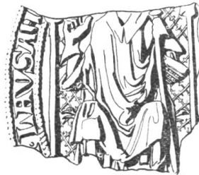
21 Othon de Champvent 1312