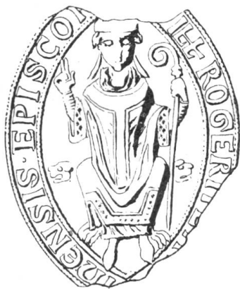
7 Roger le Toscan 1199