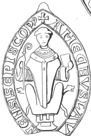
3 Amédée de Hauterive 1147