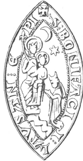
11 Boniface Clutinc 1231