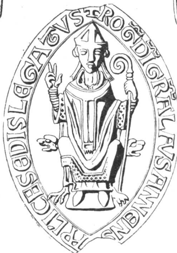
6 Roger le Toscan, 1181