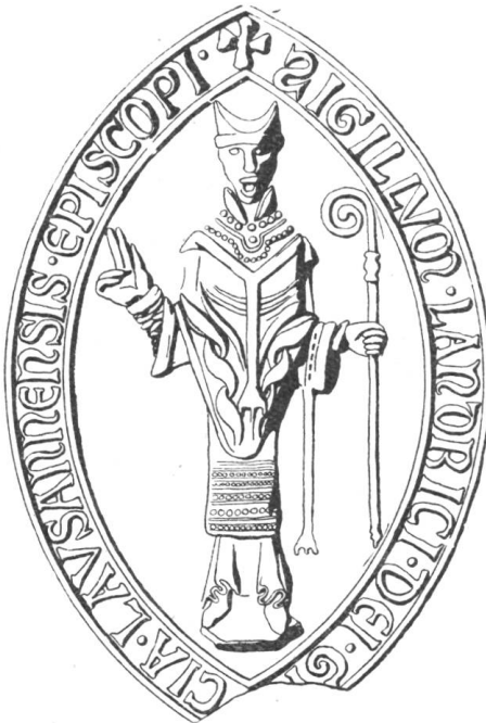
5 Landri de Durnes 1166