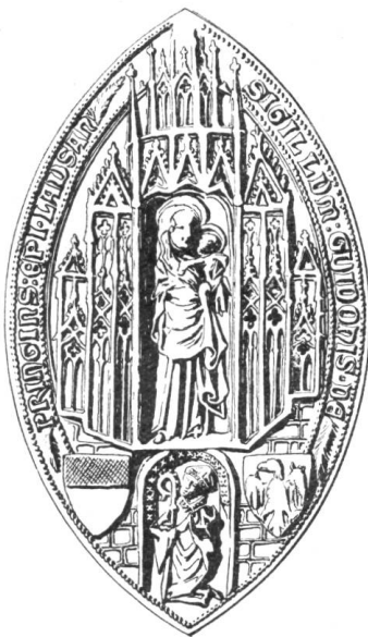
42 Gui de Prangins 1375