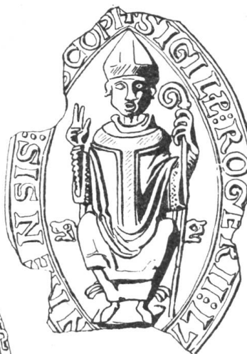
8 Roger le Toscan 1208