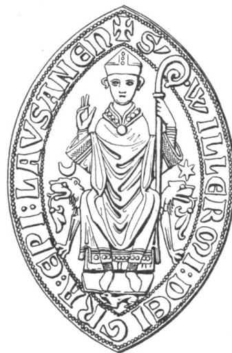
17 Guillaume de Champvent, 1273