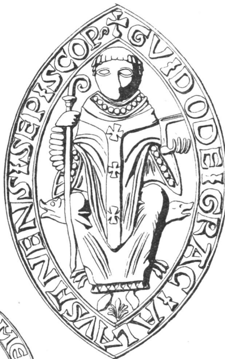
2 Gui de Marigny, 1135