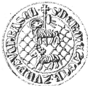
Fig. 211. Zunftsiegel XIV. Jahrh.

In der Rangordnung der Basler Zünfte ist E.E. Zunft zu Metzgern die elfte Zunft. Ihr Zunftbrief vom Jahre 1248 ist einer der ältesten der uns erhaltenen.