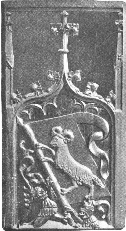
Fig. 214. Zunftbanner. Holzschnitzerei. XV. Jahrh.

gewerbe treibt, aber sich der Abrede nicht fügen und der Zunft nicht angehören will, soll am Fleischverkauf nicht teilnehmen können. Diese Ordnung von 1248 setzt also noch einen in die Häuser einzelner Metzger verteilten Fleischmarkt voraus; indem sie den Bestand der Zunft und alle Rechtsfolgen an die Gemeinsam-