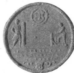
Fig. 210. Siegel der Seiler.

Erwähnt sei, dass in neuer Zeit — vermutlich seit dem Ende des XVIII. Jahrhunderts — der weisse Zunftschild gelb geführt wird. Weshalb man die durch lange