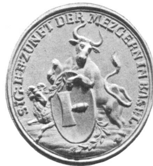
Fig. 216. Zunftsiegel XVIII. Jahrh.

keit des Feilbietens in der School knüpft, ist es um die nichtzünftigen Metzger geschehen. Wir finden solche später nicht mehr, sondern der Besitz eines Schoolbanklehens ist dann Voraussetzung des Metzgerberufes 9) .