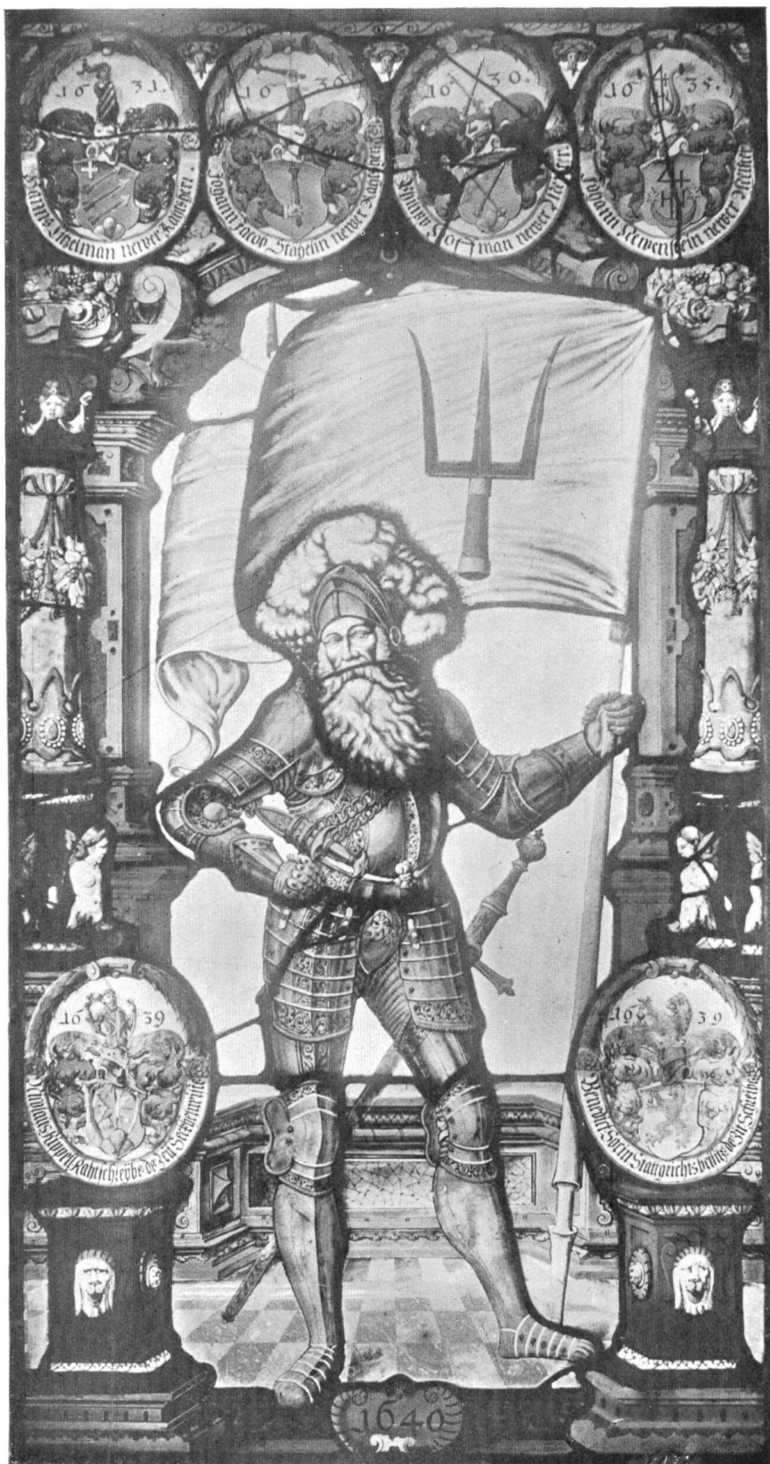
Bannerträger E. E. Zunft zu Gartnern. Glasscheibe von 1640