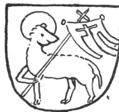
Fig. 212. Zunftschild 1415.

Er gibt Bestätigung einer von den Metzgern getroffenen Abrede, die jedoch nicht das Schlachten regelt, sondern den Fleischmarkt, den Kauf und Verkauf alles