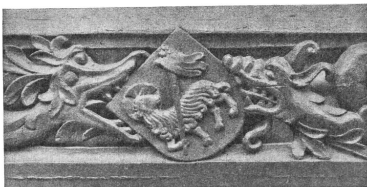
Fig. 213. Zunftwappen. Balken aus dem Zunftsaal. XV. Jahrh.

Er gibt Bestätigung einer von den Metzgern getroffenen Abrede, die jedoch nicht das Schlachten regelt, sondern den Fleischmarkt, den Kauf und Verkauf alles