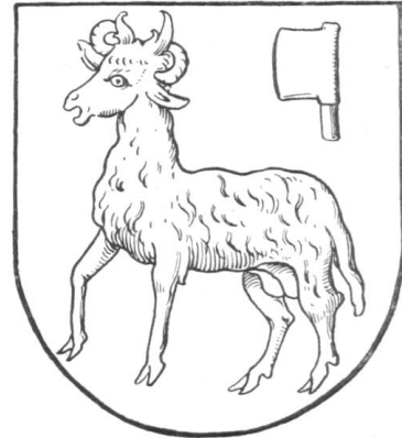
Fig. 215. Zunftschild am Lettner zu St. Leonhard, XV. Jh. Zeichn. † Carl Rochet