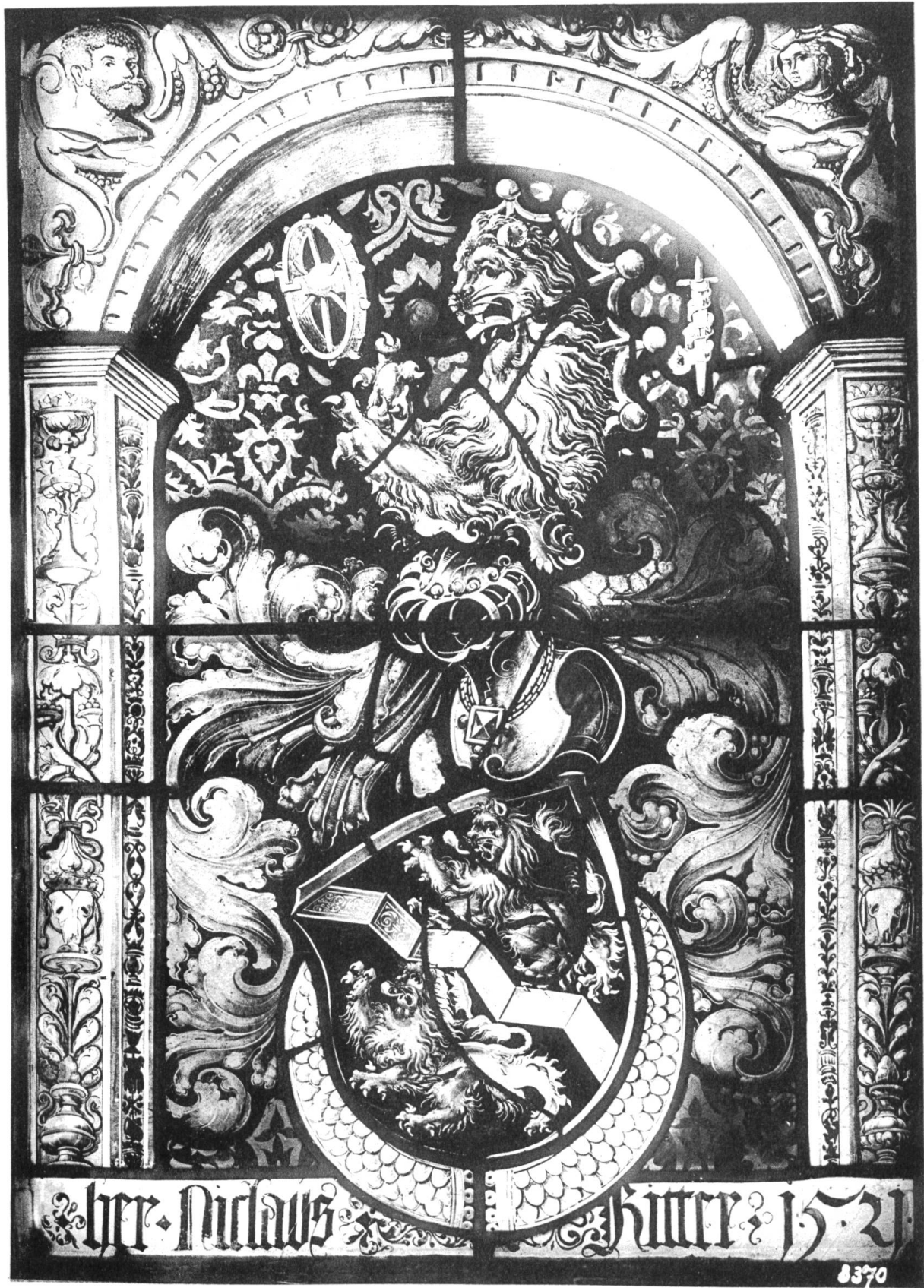
Nikolaus von Diesbach. 1521.