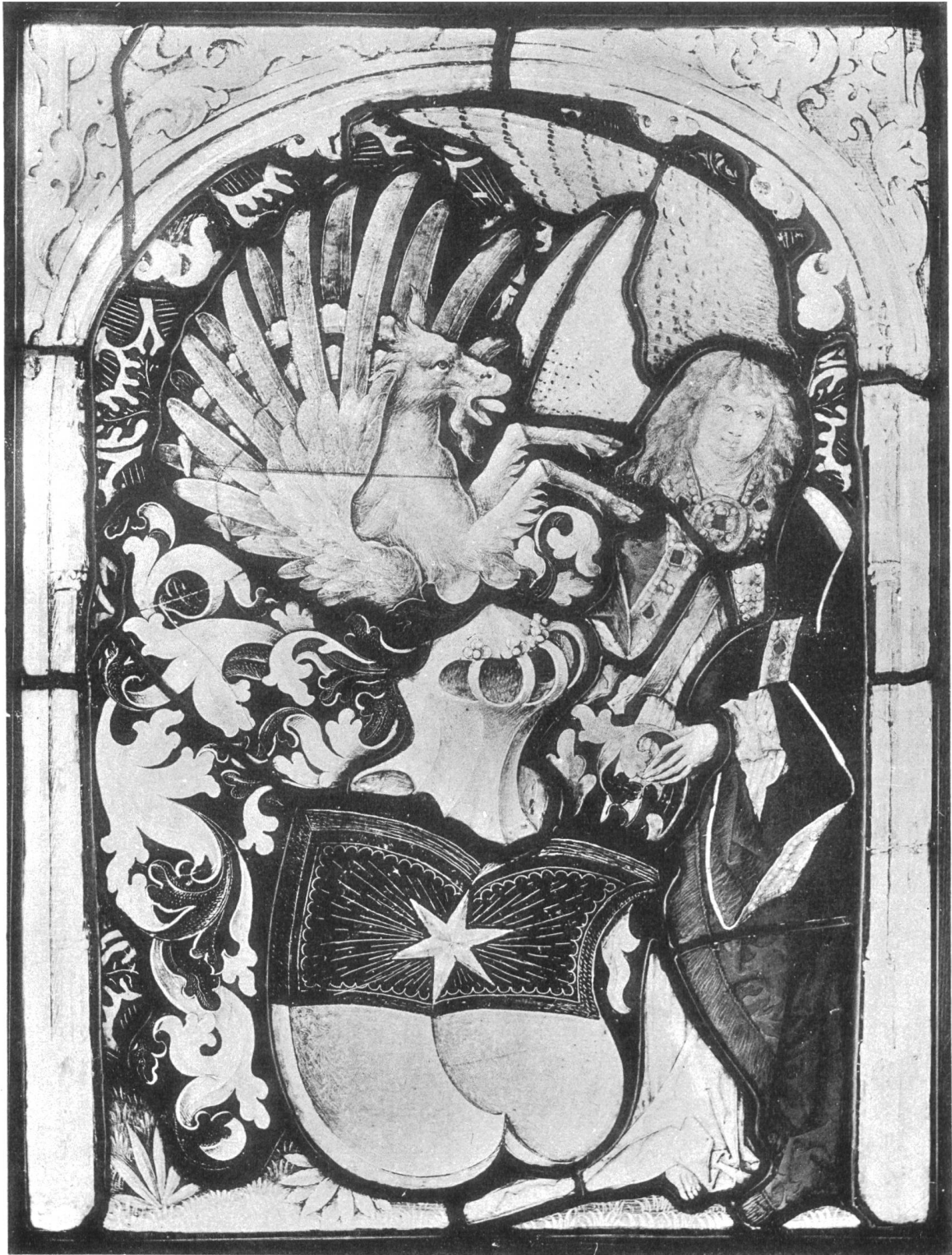
Freiherren von Heven. ca. 1500.