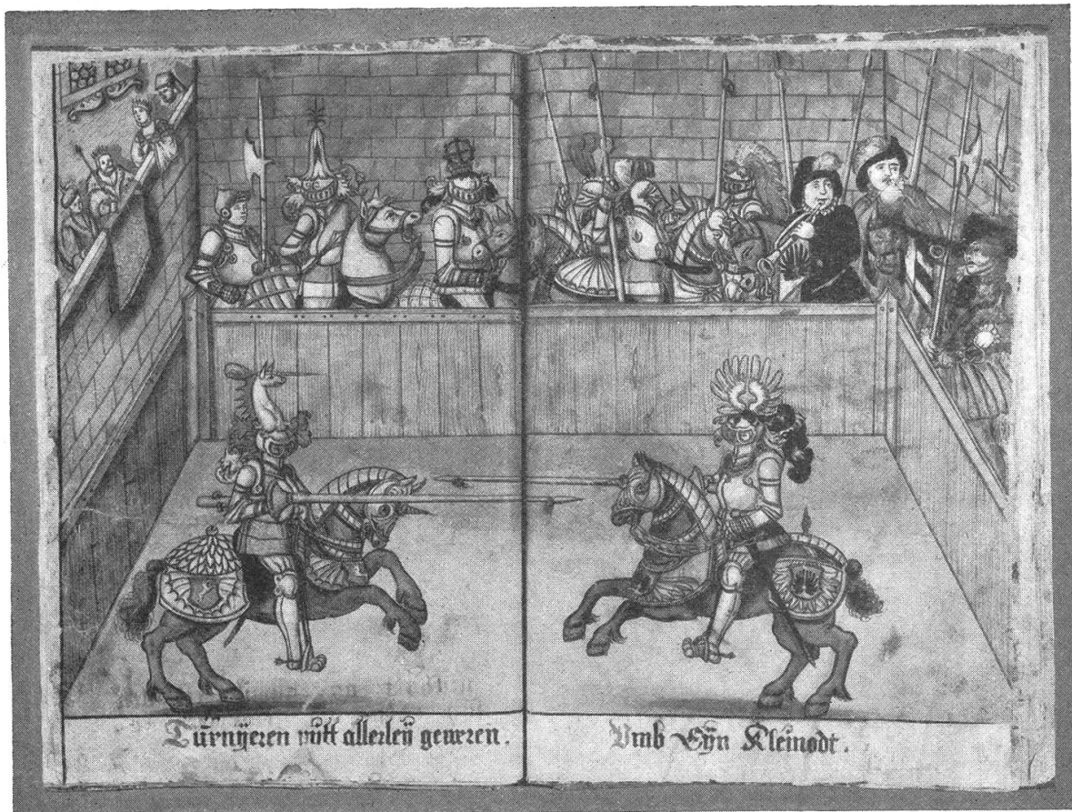
Fig. 50. Turnierszene aus dem Hallwiler Hausbuch.

neue 46. Jahrgang 1930 des Münchener Kalenders mit Zeichnungen von Professor Hupp und genealogischen Erläuterungen von Oberarchivar Dr. phil. Friedrich von Klocke bringt das doppelseitige Wappen Sr. Heiligkeit Papst Pius XI. und die Adelswappen von Attems, Baumbach, von der Berswordt, Gagern, Hoensbroech, Holleben, Mauchenheim genannt Bechtolsheim, von der Pahlen und von Koskull, Riedheim, Schele, Sydow, Volckamer. Damit finden die Stammwappen des unübertroffenen Künstlers Otto Hupp eine treffliche Erweiterung. In gewohnt feiner Aufmachung, Grösse und Stärke bildet auch der neueste Jahrgang ein farbenbuntes Schmuckstück von erlesenem Reiz. Den Kalender (Verlagsanstalt vorm. G. J. Manz in Regensburg, Preis 3 Mark) zu empfehlen ist überflüssig, es braucht nur auf erneutes Erscheinen hingewiesen zu werden. Auch diejenigen, die der Wapenkunde fernstehen oder keine ausgesprochenen Freunde der Heraldik sind, finden in dem wirkungsvollen und anregenden Kalender einen schönen, tägliche Freude spendenden Jahresbegleiter. O. v. T.