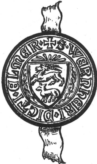
Fig. 57. Siegel Werner Elmer 1318.

An Urkunde vom 14. November 1289 im Staatsarchiv Zürich befindet sich ein Siegel der „Landleute zu Clarus, in dem ampte des Elmers“ (Fig. 54), welches ein spitzovales Wachssiegel ist. Umschrift: ✠ SIGILLVM CLARONENSIVM. Maria mit dem Kinde, unten ein Betender. Laut Glarner Urkundensammlung Bd. I hängt ein gleiches Siegel an Urkunde vom 25. Juli 1313 im Landesarchiv von Uri.