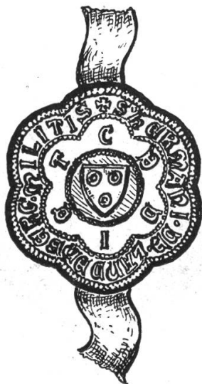
Fig. 59. Siegel Herm. v. Landenberg 1335.

Siegel von Eberhard von Eppenstein , Pfleger zu Kyburg, an Urkunde vom 21. Juli 1329 im Staatsarchiv Zürich (Fig. 58). Laut Glarner Urkundensammlung