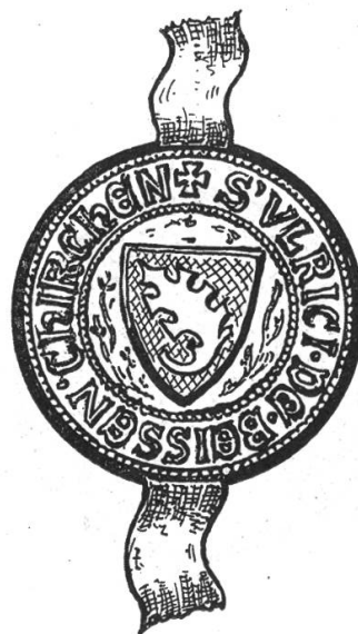
Fig. 59a. Siegel Ulrich von Wissenkilch 1331.

besiegelt dieser Ritter als Pfleger ze Kyburg und ze Glarus eine Urkunde am 10. November 1327. Umschrift: ✠ S · ERHARDI · MILITIS · DE · EPPENSTAIN.