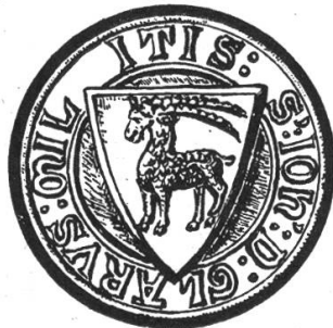
Fig. 55. Siegel Rudolf Tschudi von Glarus 1299.