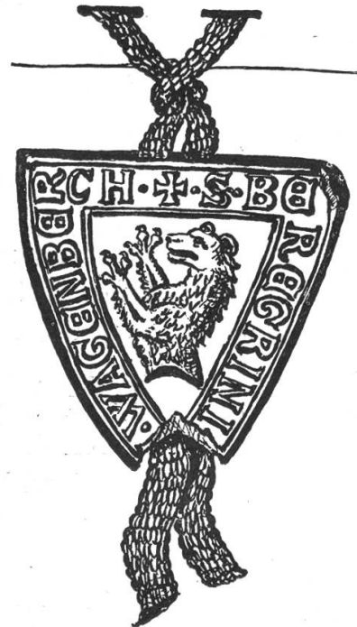
Fig. 56. Siegel Bilgeri von Wagenberg 1296.

geheissen haben soll. Seine Wahl erfolgte nicht durch die Talleute des Glarnerlandes, sondern durch die Grafen von Kyburg, welche damals die Herrschaft zu Windeck besaßen. Ob Stege und Stäger identisch sind, muss noch als offene Frage gelassen werden. Vide auch Lexikon Leu von Bürgermeister Joh. Jakob Leu von Zürich, Band VII, Fol. 478.