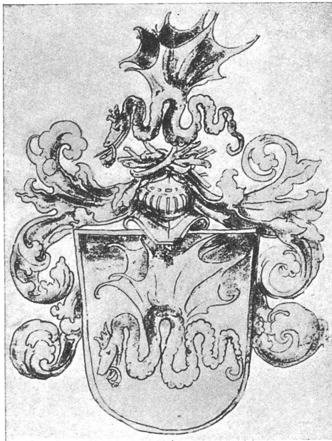
Fig. 169. Wappen, verliehen von Kurfürst Friedrich III. an den Maler-Apotheker Lukas Cranach.

kischen Städtchen Kranach Geborene ward 1504 Hofmaler des Kurfürsten Friedrich III. von Sachsen. Cranach muss schon zu dieser Zeit Apotheker gewesen sein, wenn auch die Urkunde, welche als Beleg gilt, 16 Jahre jünger ist. Im Jahre 1520 nämlich erwirbt der Genannte die Apotheke in Wittenberg käuflich und führt sie persönlich. Noch heute befindet sich im Lukas Cranachhaus die Adlerapotheke. Erst im vorgerückten Alter, als er zum Bürgermeister von Wittenberg gewählt worden war, liess der Malerapotheker seine Offizin durch einen Schwiegersohn Kasparus Pfrund verwalten 1) . Mehr ist über die Tätigkeit Cranachs als Apotheker nicht auf uns gekommen. Sie ist als ursprüngliche neben einem zweiten Beruf