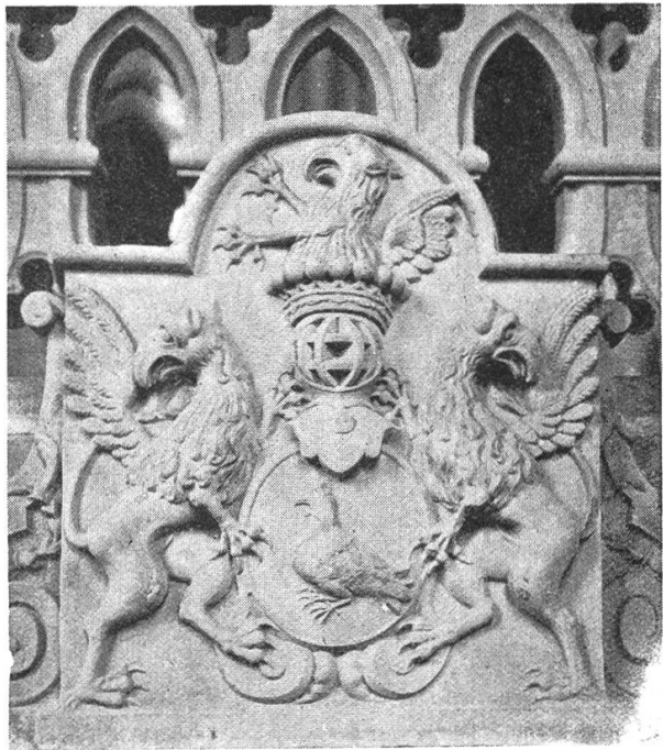
Fig. 266. Armoiries d'Abraham de Crousaz, 1710.

Signalons encore dans le sol du chœur, un peu en arrière des deux tables de communion, une dalle, en pierre noire de St-Triphon, portant les armoiries de la famille de Loys, gravées au trait, et déjà passablement effacées. Au-dessus de