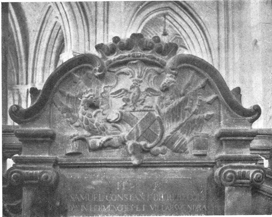
Fig. 263. Armoiries de S. Constant de Rebecque. 1756.