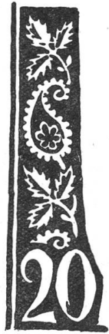
Fig. 286. Ornament für Glarus.

des Schildes auf der einen Marke von 1922, Herzog Leopold von Österreich und Arnold von Winkelried, bezeichnen den Sieg bei Sempach, der Dauphin von Frankreich und der sterbende Krieger bei St. Jakob an der Birs die Abwehr der Armagnaken, Karl der Kühne von Burgund und der Schweizer Krieger (Abb. 288) die siegreichen