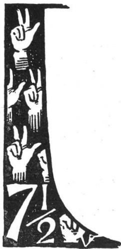
Fig. 284. Ornament für Schwyz.

zu setzen, dann den an Fischen reichen Rheinstrom darzustellen, bis er den Baselstab als Ornament für den Hintergrund wählte; Schwyz wurde mit der Schwörhand des ersten Schweizerbundes ausgezeichnet, Uri mit dem von Tells Pfeil durchbohrtem Apfel, Ob und Nid dem Wald mit Hellebarte und Morgenstern, Waadt,