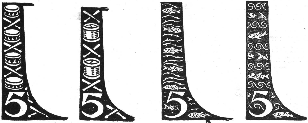
Fig. 283. Dekoration für die Basler Marke.

jede einzelne Marke enthält lokale Embleme, die auf die Hauptindustrie des Kantons, auf die geschichtliche Stellung oder auf eine allgemein bekannte Eigenschaft anspielen. Auf den abgebildeten Skizzen (Fig. 283) lernen wir Varianten kennen, die besonders für die Fünfermarke mit dem Schilde von Basel-Stadt Interesse bieten; denn Münger versuchte erst der berühmten Trommelkunst der Basler ein Denkmal