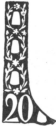
Fig. 287. Ornament für Luzern.

Burgunderkriege, „der alte und der neue Eidgenoss“ die politische Wendung im XVI. Jahrhundert und „der Löwe von Luzern“ auf der letzten Marke von 1926 das Ende der alten Eidgenossenschaft, deren Wappen den Untergang überdauernd, emporsteigt. Münger hat das Schweizerkreuz auf seinen Marken variiert und die