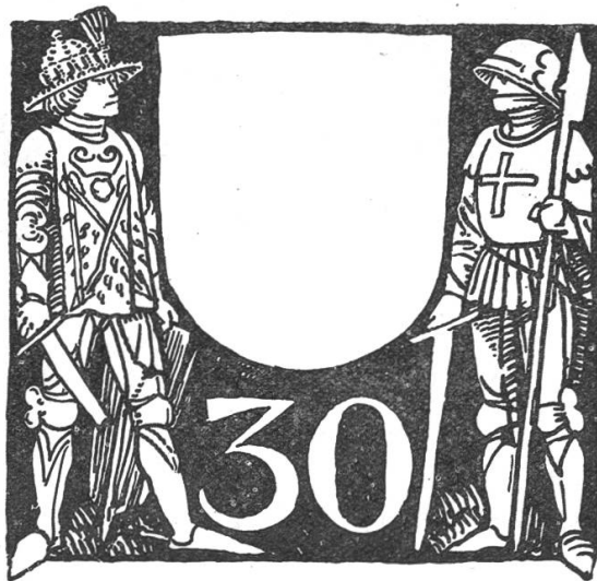
Fig. 288. Pro Juventute-Märke 1924.