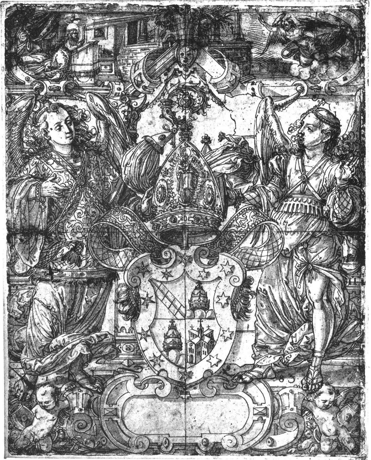
Beat Papst, & Abt von Lützel 1583.