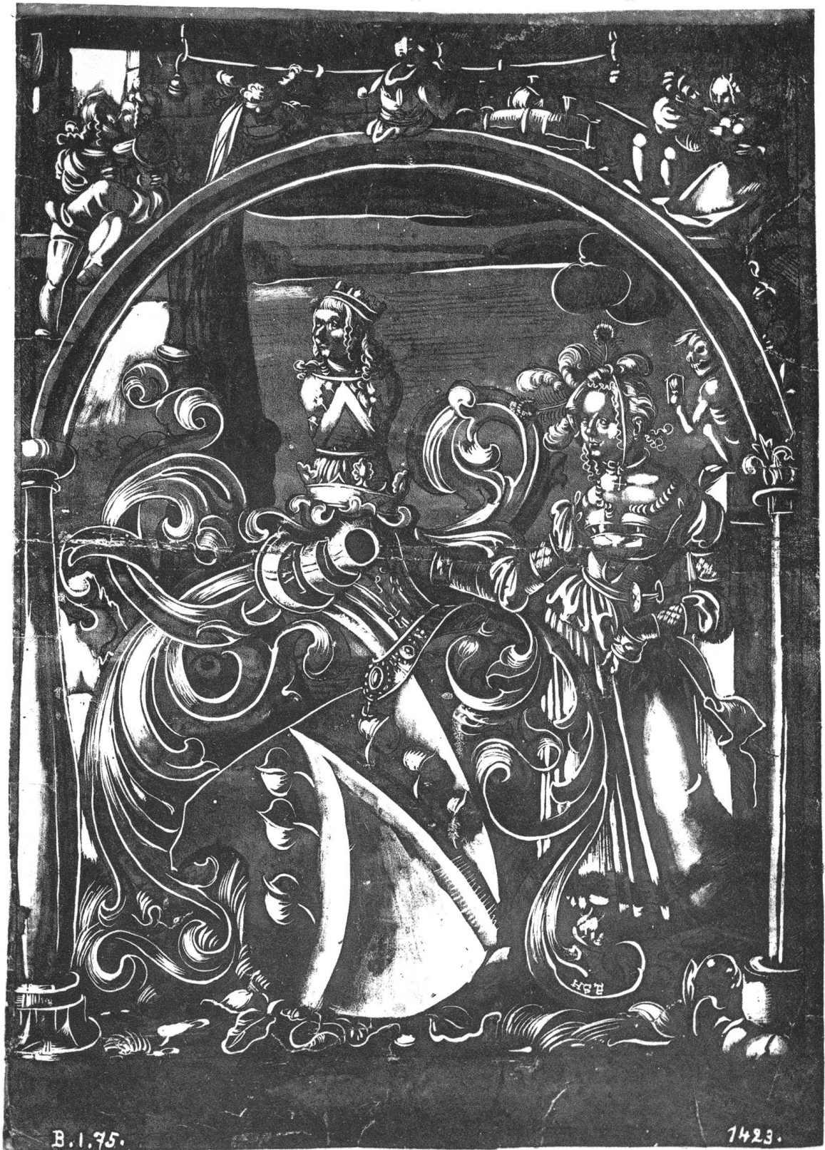
Unbekanntes Wappen. Ca 1515.