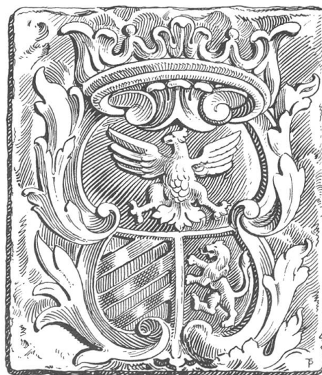
Fig. 48. Armoiries Gabuzzi.