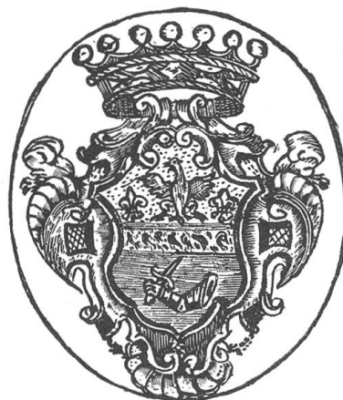
Fig. 46. Ex-libris du Dr. G.A. Ferrini.

L'ex-libris ne nous fixe pas sur les émaux des meubles de ces armoiries. Je crois qu'il faut lire: d'azur à un dextrochère d'or brandissant une épée du même, le chef d'or chargé d'une aigle de sable accostée de deux lis d'azur et soutenu d'une devise d'argent à mouchetures de sable (probablement un diapré ou un papillon mal compris).